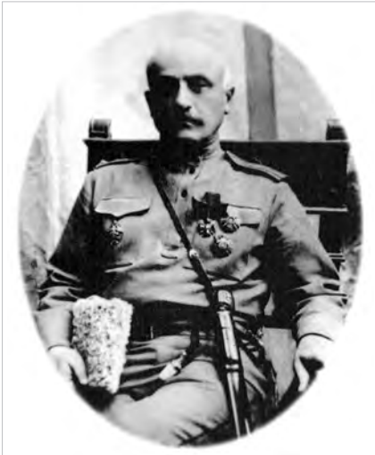
Դանիել Բեկ-Փիրումյան (1861–1921)

ու ազատության ձգտումը, որ մեր ժողովուրդը միշտ պատրաստ է զենքը ձեռքին պաշտպանել իր անկախության և ազատության սուրբ իրավունքը: