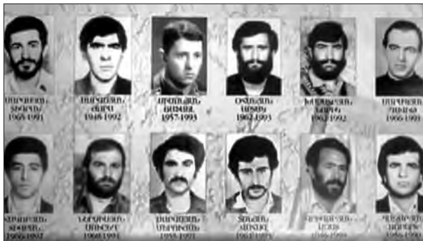
«Մեծն Տիգրան» աշխարհագորային գեղի մարտիկները

«Մեծն Տիգրան» աշխարհագորային գեղի տղաների համար անմոռանալի է Դավիթի