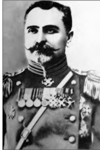
Պողոս Բեկ-Փիրումյան (1862–1921)

Սարդարապատի ճակատամարտում, հիրավի, աննախադեպ հերոսություն են ցուցաբերել Բեկ-Փիրումյան զորավարները: Նրանց սխրանքը շատ բարձր է գնահատել Սարդարապատի ճակատամարտի մասնակից, ԽՍՀՄ ապագա մարշալ Հովհան-