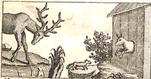
Ինք. Եղն հայի՛ն ջուր: Ինք. Ափս և Աղուէս:

Ընէլով յանողոսն ի տարայ՝ իր շնասին ալ պարս ճառս իւրաց: