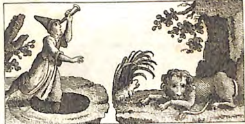
ՃԼԳ. Աստղաբաշխ : ՃԼԳ. Առիւծ և Գորտ :

Թաղէս քիլիսոբան օր յը գործիւք յետեւ եւ- թաղով ասպղերը իւր դիպեր , ընկաւ թոսի յը մեջ . Ժառան հասաւ որ զինչ անկէ հանէ , ըսաց՝ եր- ինչքին Բաները դիպելաւ Կեղծ ոպօրդ Կախէ Լե- նային : Խրատ է անոնց որ իրենց Բանը իւր դասն , ու իրենց մէկ Բաներու երեսն իւրանն , և երբեքն հասապի վրա ալ հայաճառութի իւ- շենն , որ մէկին թոսել իւր Գուբին :