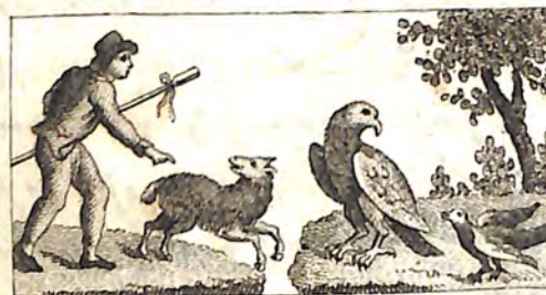
ՃՊԱ. Հովիւ և Ոչխար: ՃՊԲ. Արծիւ և Կաշաղակ: