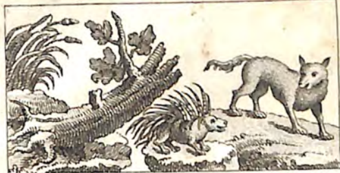
ՃԹ. Կաղնի և Եղէ գն : կն. Ողնի և Գայլ :

ՃԹ. Սաղնի ծառը կը բնորար եղէ գին վա . և նախատելով կը բեր , թէ սղտիկ հովն մը կը շարժի . ես շատ կը խոյճամ քու վաղ . երբոր կը տեսնեմ ջրին քով տնկած . ուր տեղ ուրիշ կերպ չես կրնար կենալ , բայց է թէ գլուխդ ծռած տկար հովերուն առջին : Ինձի նայէ տես ուր եմ բարձրացեր . և ինչպէս հաստատ է իմ բունս և սրմաստ , որ սաստիկ հովերու փոթորիկներու գէմ կը շնեն : Երբոր այսպէս կը պարծենար , յան կարծ փոթորիկ մը ելաւ եկաւ կաղնիին և եղէ գին զարկաւ : Այս հովը որպէս որ վէճ չի կրցաւ մնառել եղէ գին . որովհետեւ հովն առջին խոնարհելով , ուրիշ բան չեղաւ մնայն թէ շարժեցաւ : Իսկ բոլոր մնասը կաղնիին եղաւ . վասն զի երբոր խիտ դէմ կեցաւ հովն , ու կարծեց հաստատուն մնալ փո թորիկին դէմ , մէկ կատարած հովմը զարկաւ անոր , և անանկ ցնցեց , որ շրջեց պառկե ցուց ծառը : Եւ այսպէս ահա այս հոգարտ ծառը եղէ գին ոտքն ընկաւ , որ այնչափ նա խատեր էր զայն :