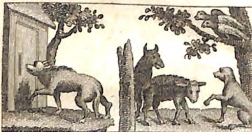
Ի՞նչ՝ Ուլ և Գայլ: Ի՞նչ՝ Ոչխար և Հուն: