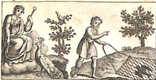
Ընէ՛ Մերամարդ և Սոխակ ինք՝ Ոարեակ և Հաւորս։