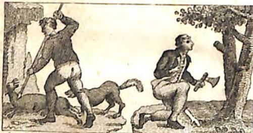
ԸԹ. Աղուէս և Գայլ: ԸՇ. Փայտահատ և Անտառ:

Արտաքուստ միայն գեղեցիկ վառու՛ն, Բայց անխել յաւէտ արձան ըստնէրբոյն: