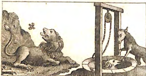
մՂ. Առիւծ և Հանձ: մե՛ր. Աղուհն և Նոխար: