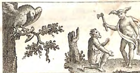
Տէ. Ուրուր և Կուսին: Տէ. Հերմէս և Վայտամաս: