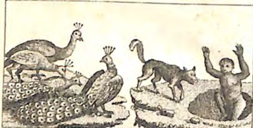
ԸԹ. Կաշաղակ և Սիրամարգ. ԸՇ. Կապիկ և Աղուէս: