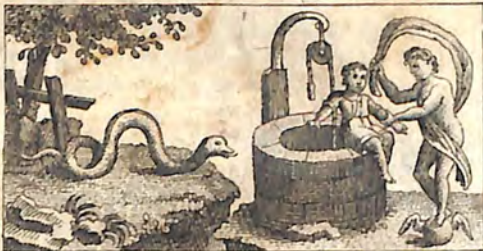
ՃԾԷ. Օձ և տուտն: Ճկդ. Երկտասարդ. և Բաղդ: