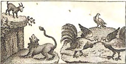
Ծ՛՞՛ Առ իւծ և Ու՛ւ՛ : Ծ՛՞՛ Կարաւ և Աքաղաղ։