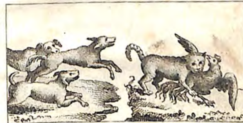
կն. Գայլ և Հոււնք : Տն Կատու և Աբաղաղ :