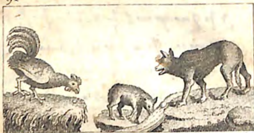
Է. Արաղաղ և Վարդարիտ: Ը. Գայլ և Գառն: