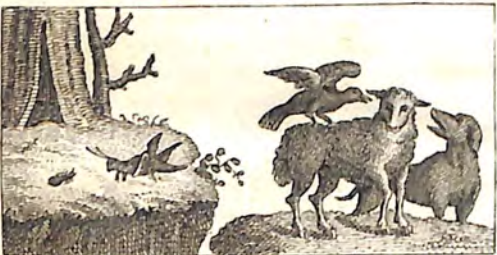
Ծ՛՛՛ Հայրուսն և Մըղիւն։ Ծ՛՞՛ Ագուս և Ալխար։