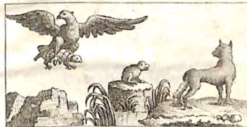
Տէ. Կրկայ և Արծիւ: Տէ. Գորտ և Աղուէս: