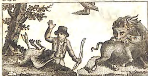
ՃՆՐ. Արծիւ. նե տասար: ՃՃԱ. Առիւծ, Կինճ և Լնգը: