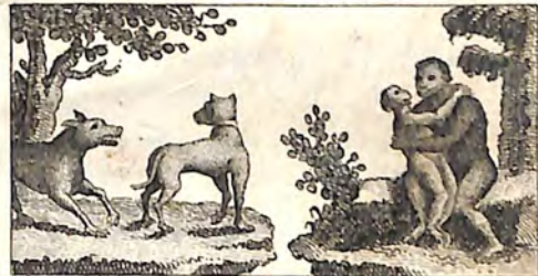
ՃԳ. Գայլ և Շուն վտիտ: ՃԺ. Արապիկ և ճագ իւր: