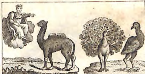
դէ. Ուղար և Դիոս : դէ. Սիրամարգ և Կոռնիկն :

դէ. Օր մը ուղար քէվէն կը արտնջար Դիո. սին, թէ ինչո՞ւ համար չածնե՞րը ցուլն կի՞ եղն եղջիւր արւին, ու ինձի մինակ ականջ արւին . կերևնայ թէ կըսէր արտնջողը, ել- ջիւրնէն ինձի այն կենդանիէն շատ աւել- լն կըվայլէին . և եթէ անոնք գլխուս վրա բուսած ըլլային, շատ աղւոր սկտի էրևնայի. որ ինձի կրնային ծառայելու թէ վարդա-