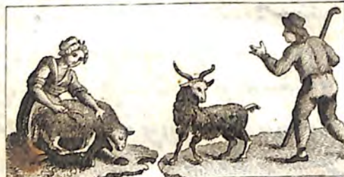
ՃՃԵ. Կին և Ոչխար: ՃՃԶ. Հովիւ և Այծ: