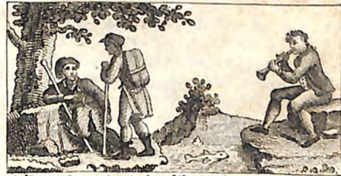
ՃԻ. Ուղևորը և Սօսի: ՃԳ. Չկնորս և Չկուկը: