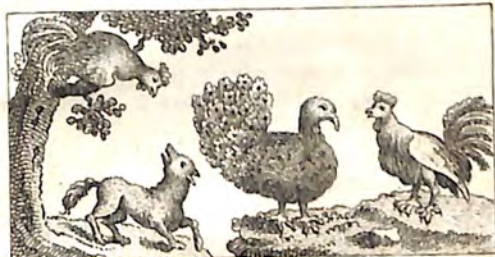
կն. Աղուէս և Աբաղաղ : կն. Աբաղաղ և Հնդկանաւ :