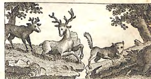
ՃԼԳ. Եղն և ձագ իւր : ՃԼԳ. Աղուէս և Կինծ :