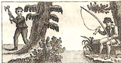
ճ. Եղևին և Տորենի : ճն. Չկնարս և Չուկն փոր :