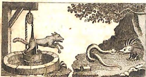
մՃԵ. Աղուհն և Գայլ: մՃԴ. Ողնի և Օձ: