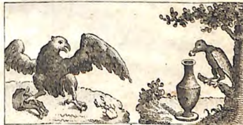
ճբ. Արծիւ և Բզէզ : ճճ. Ագռաւ ծարսի :