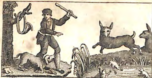
Ի՞նչ՝ Որսորդ և Հուն Ի՞նչ՝ Նապաստակը: