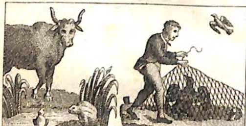
ԸԹ. Գորտ և Կով: ԸՇ. Աղւանի և Բազէ: