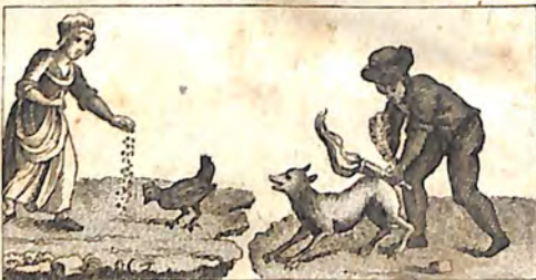
Ճկդ. Հաւ պարարտ: Ճնն. Երկրագործ և Աղուէս: