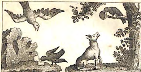
Ժն. Արծիւ և Ագռաւ: Ժբ. Աղուէս և Ագռաւ: