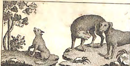
Ը՞մ. Աղուէս և Խաղող: Ին. Գայլ և Շուշ: