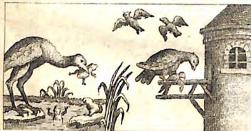
Ժե. Գորտը Սըռ Ննորեն: Ժզ. Աղաւնիք և Ուրուր:

Օրինակ է հարուստ և միայն ճարտիւնը. Քէլ աղէն թշուաթի ունի հանգստութի լուսի, Քէլա ւը հանգստութի ունի թշուաթի լուսի. Բայց ա սոր լիճալը թէլակէն լապ լաւ է. որովէնքա ճաւ դոսս սրբաբ թագոսի է ճարտիւն: Երբոր հան գիսս իլըւայ առանց սրբաբողի, սնիկ աւելի թշուաթի լըւար: