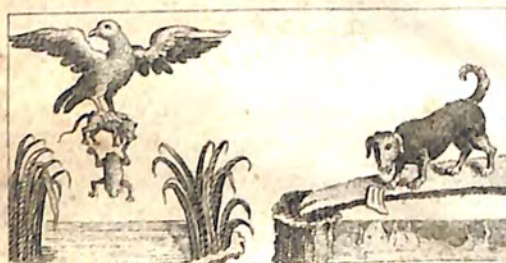
Ը. Գորս և Վառկն: Է. Հուն և Սառեք: