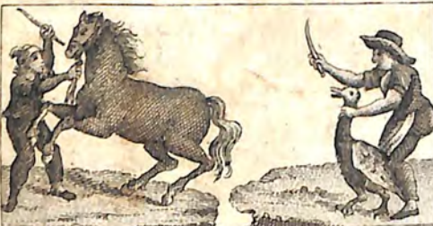
Ճնն. Չիարարմ և Չի. Ճնդ. Արտավար և Կարապ:

բուն էր՝ վաղեց ընկաւ ոչխարներուն վրա բոլորը ջարդեց :