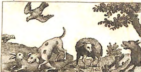
ՃՂԳ. Նասպաստակ և Կարաւ. մե Գայլ և Ոչխար: