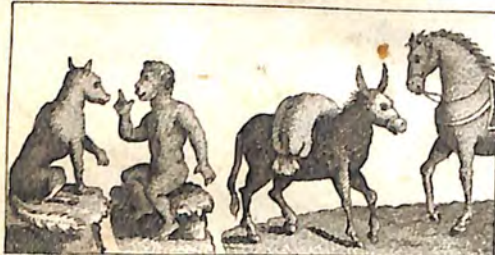
Ինք. Կապիկ և Աղուէս: Ինք. Չի և Կշ: