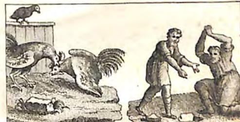
ՃԼԳ. Արաղաղ և Բազէ : ՃԼԳ. Ագահ և Անցաւոր :