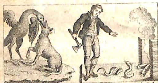
Ը. Գայլ և Առունկն: Ը. Արկաղաղը և Օձ: