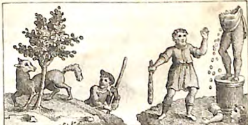
Տէ. Աղուէս և Մորենի: Տէ. Մարդ և Կուռք:

Տէ. Մէկ մարդ մը աղուէսին տուէն ընկաւ որսալու համար. անալ փախաւ գնաց մորմենիին մէջ մտաւ պահկեցաւ, որպէս զի կարենայ աներևոյթ ըլլալ հալածողին տեսութիւն. բայց նայեցաւ որ մորմենիին փշէրը վրան գլուխը պատուեր են՝ ըսաւ ինքիրեն. այս ի՞նչ անխելութիւն է իմն ըրածս, որ այս անղգամին ապաւինեցայ.