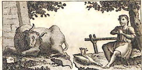
ՃՂ. Յուլ և Մուկն: ՃԺ. Սագ և տէրն:

Ո՛վ նապար թէ մէկ մուկ ճը իննայ այսպէսի ուժով կենդանիին ասանկ բան ընէւ. Բայց փեպ նան ինքնահասան ճարտիլ, որ պղտի թնամին ի՞ննայ մեծ լար ընէւ. և ասով պէպ է խոտարհիւ: