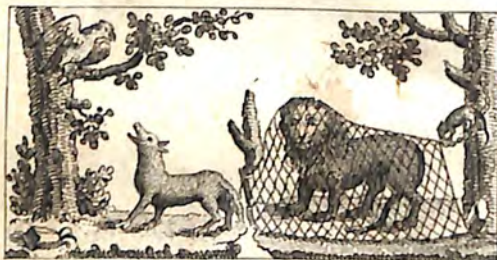
Ժգ. Աղուէս և Արծիւ: Ժդ. Առիւծ և Մուկն: