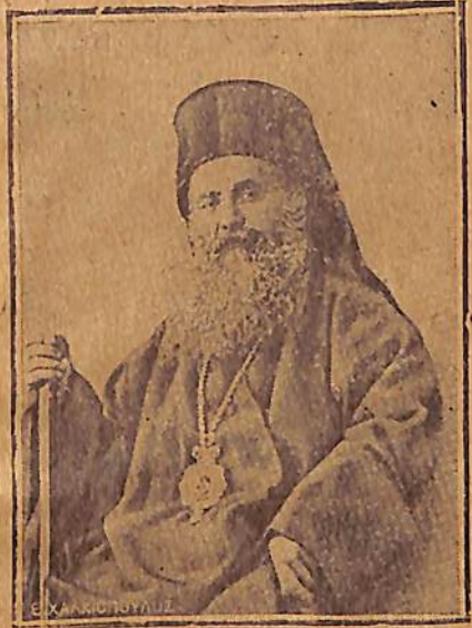
ԳԵՐ. ԽՐԻՍՏՈՍՏՈՄՈՍ ԶՄԻՒՆԻՈՅ ՄԵՏՐԱՊՈԼԻՏ (Նահատակուած 922 Սեպտեմբերին)

Մարտանաւին մէջ մնացինք երեք օր և վայելցինք բարեացակամութիւնը Ֆրանսական հիւպատոս Պ. Կրէյքէի ինչպէս և Մօնսէննօր վալէկայի և Լազարիստ միաբա- նութեան վերատեսչին ու հայրերուն»: