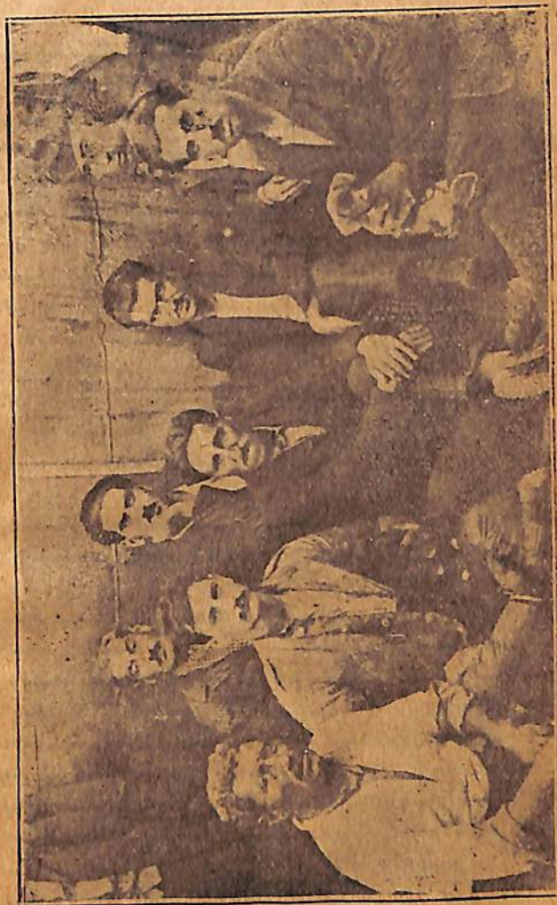
Բ. ԽՄԲԱՆԿԱՐ՝ ԱԶԱՏԱԳՐՈՒԱՄ ԸԱՅ ԳԵՐՈՆԵՐՈՒ

Ամէն բան իրենց ձեռքին մէջ կեդրոնացնելու մո-