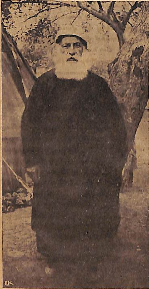
ՅԱՐՈՒԹԻՒՆ ԳՂՆ. ՍՍՐԳԻՍԵԱՆ ԳԵՐԻԻ ՏԱՐԱԶՈՎ