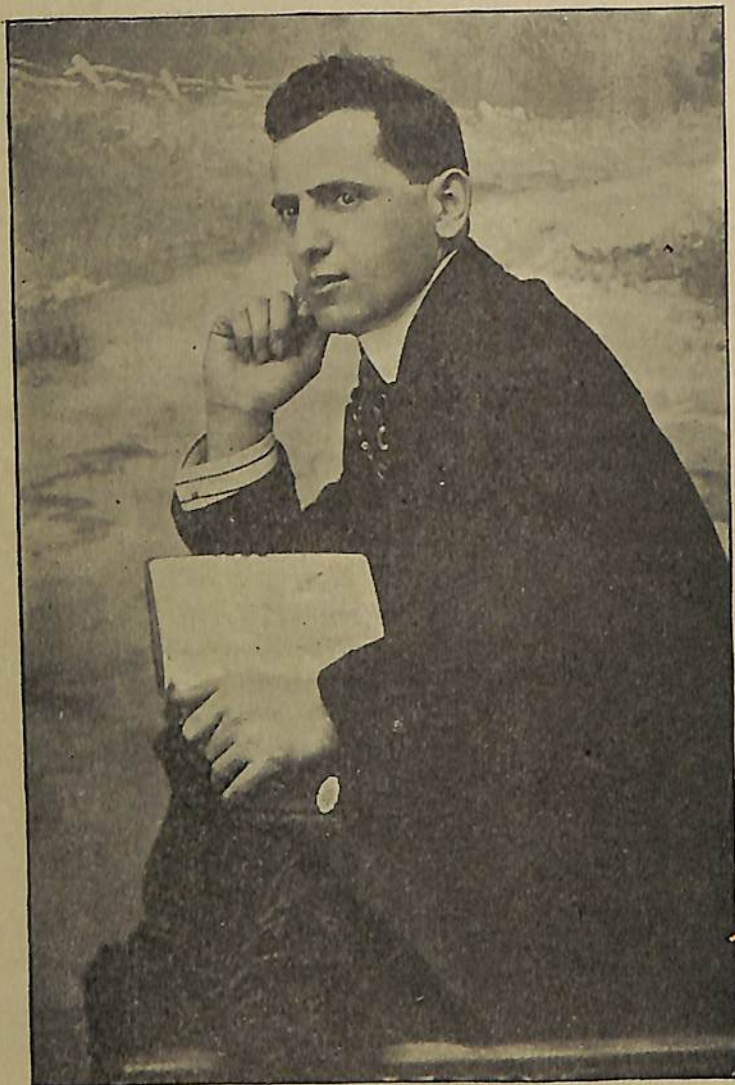
«ՅԱՂԹԱՆԱԿԸ» ԻՆ ՀԵՂԻՆԱԿԸ