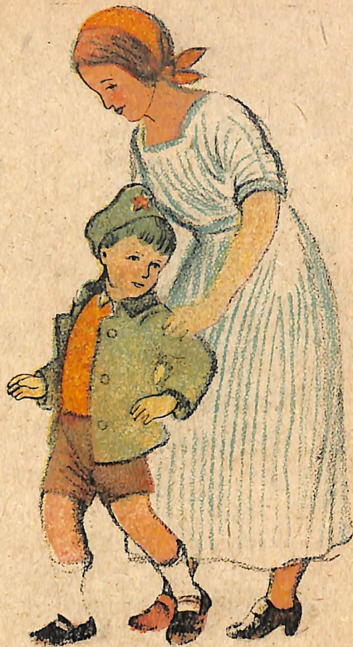
Մայիսի մեկին— Ռազմերթ ու յերգեր:

Մասնակցել յերթին՝ Ուզում եմ յես եր: Բայց ինձ չեն թողնում Շքերթ գնալու, Վոր մի լավ տեսնեմ՝ Ի՞նչ ե լինելու: