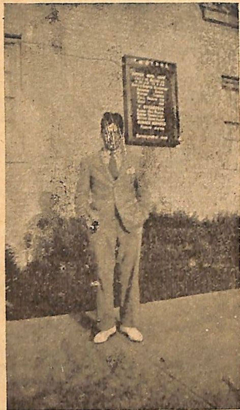
Թոռնիկ 1935 ին