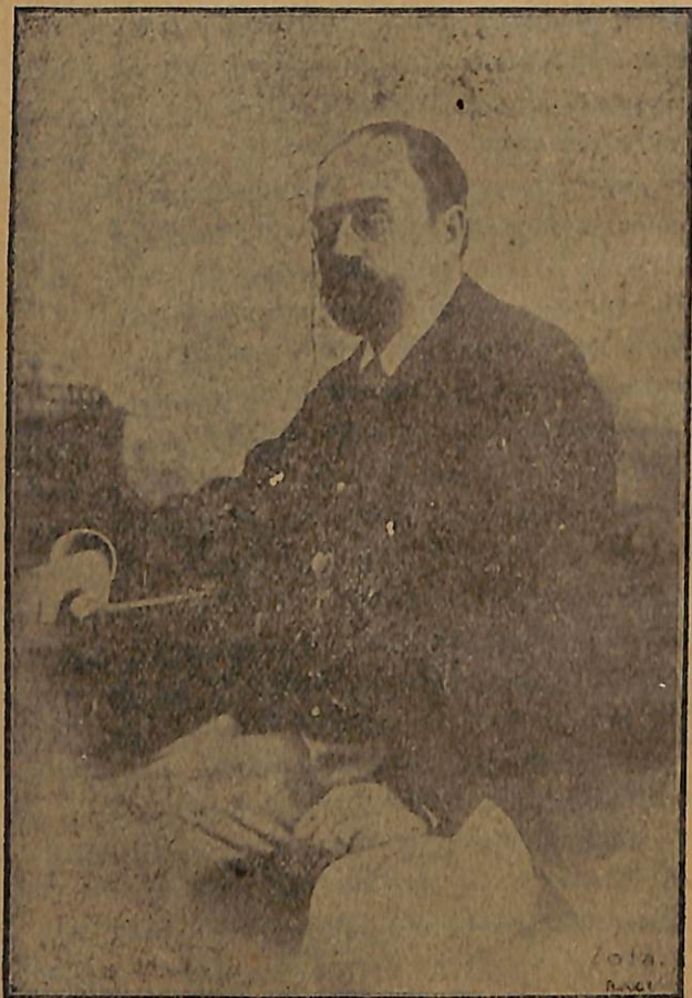
ԷՄԻԼ ԶՕԼՍ (1840 - 1902)