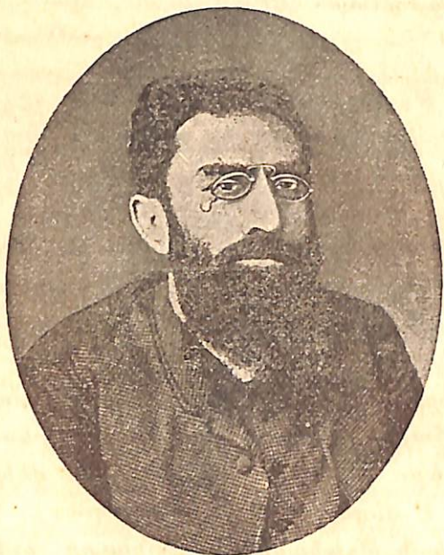
Ա Ր Ժ Ր Ո Ւ Ն Ի