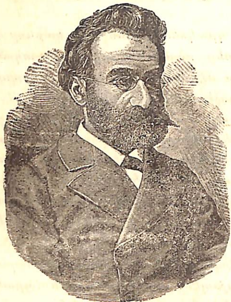
Բ Ա Փ Փ Ի