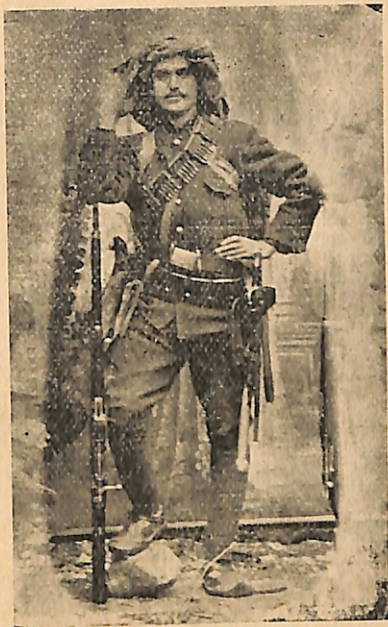
ՏԻԳՐԱՆԱԿԵՐՏՑԻ ՉԻՆԻՈՐ ԱԻԵՏԻՍ ԳԱՐԱԿԷՕԶԵԱՆ