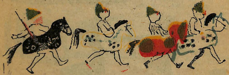
Հրաման.—«Արշավով մա՛րչ»: Արև բլ բազում են:

Տրու-տո՛ւ, տո՛ւ, տու-տրո՛ւ, փող- հարում է փողհարը: Քաղժամը վեր- ջացավ: Սկսվում է հեծյալ յերթը: Հրամանատարը հրաման է տալիս.— «Քայլով մա՛րչ»: Հեծյալները մեկնում են դանդաղ քայլով: