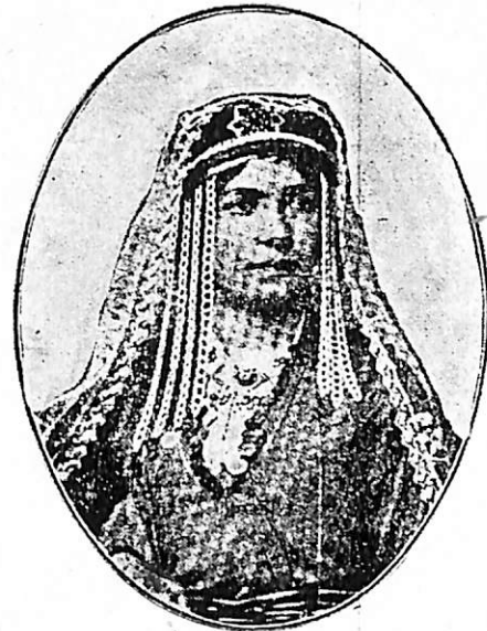
Հ Ա Յ Հ Ա Ր Ս Ը

Սարգիսեանին ծաղկահաս թոռնիկը Մարեամ միայն այս վարդավառեան բռնագրօսիկ հանդէսին չէր եկած. արդեօք իր նոր երկնագոյն պարեգօտը խնայելու մտքով, թէ ուրիշ պատճառ մը ունէր... Աւանդութիւն մը կ'ըսէ թէ. «այսօր թրջուիլը բախտ կը բերէ:»