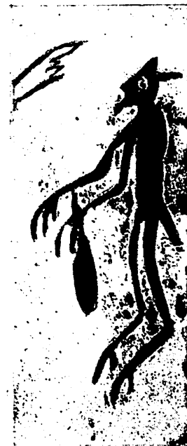
Վ. Հ Ո Ւ Կ Ը

Եագրճեանց տնպահ Մելքոն, նոյն այս երանեակ գիշերին հետեւեալ օրը դարձեալ հասկեր կը հատանէր: Չկար ցօղուն մը, ամէնէն յամառն ու հողին կպածը՝ որ այս Հայ հուժկու մշակին ձեռքի կիսալուսնի շեղբին, եւ անոր պողպատէ բազուկին դիմանար: Ատոգահաս ցորենի գլուխներ դիտաբաստ գետին կը թափէին անոնց նման՝ որ իրենց փառքով