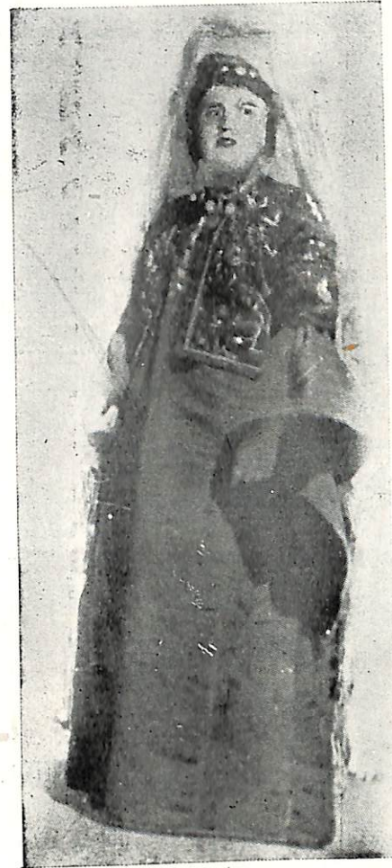
Փ Ս Ռ Ս Ն Ձ Ն Մ

Մինչ փառանձեմ ամառանոց դառնալուն, համ- բան իր նախանձը կ'որոճար, մամիկին տունը բոլո- վին տարրեր տեսարան մը տեղի կ'ունենար: Մա- րիամ, այն եղաւ հնազանդ սիրուն աղջնակը, մէկ ժամուան մէջ կարծես թի՛ղ մը մեծցած՝ վեր առաւ գլուխը՝ հազիւ Փառանձեմ դուռը գոցած, վճռեալ շեշտով մը՝ հանեց մատէն խօսկապ մատանին, մօ-