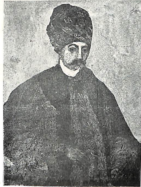
Ս. Մ Ի Բ Ս. Ն