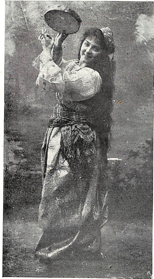
Հ Ա Յ Պ Ա Ր Ո Ւ Հ Ի Ն