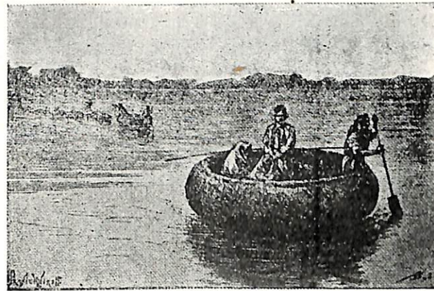
ՆԱԽԱՐԿՈՒԹՅՈՒՆ ՏԻԳՐԵՍԻ ՎՐԱՅ

Հազիւ Տէիրմէն-Տէրէ (48) գետը անցած՝ երիտասարդութիւնը՝ ծաղկած սարաւանդներն ի վեր կը մագլցէր: Անոնց կանանց գարունները պառաւնալէ վախ չունէին, իրենց անծալ ճակատները արեւին կուտային, բարբիտն ծաղիկներէ երփներանգ պսակներ կը