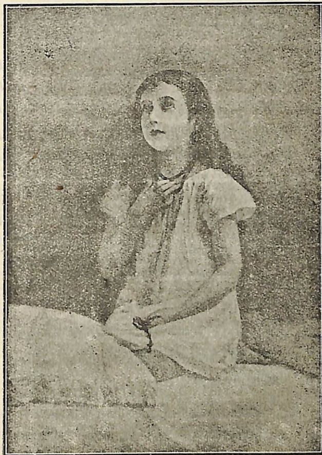
Ա Ր Մ Ի Ն Է Կ Ա Ղ Օ Թ Է

Արսասանուրիւն վերի երկու ոսանաւորներուն :