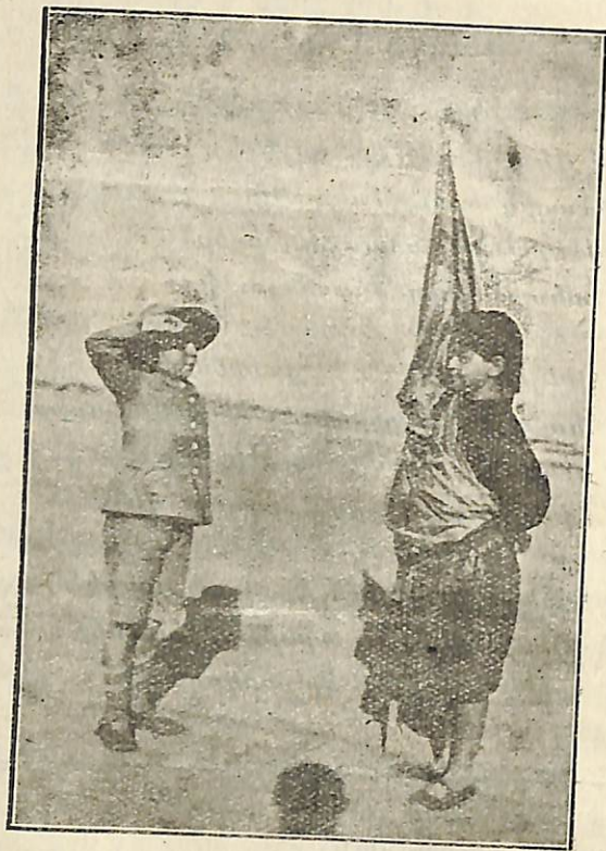
73. Ի Մ Դ Ր Օ Շ Ա Կ Ս