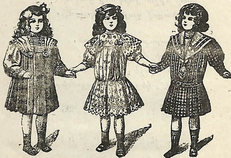
75. Վ Ի Ճ Ա Կ