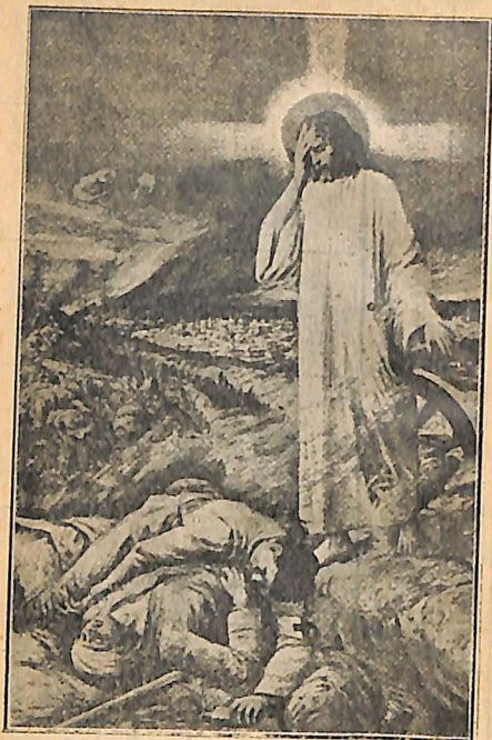
« Խաղաղութիւն արարէք ընդ միմեանս »: