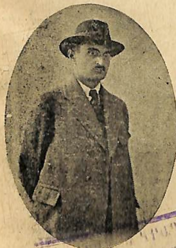
Ա. ՄԻՍԿԵԱՆ Հ. Ս. Խ. Հանրապետական Արտ. գործող ժող. կոմիտատ