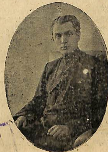
Գ. ՄԱԿԻՆՅԱՆ Հ. Ս. Խ. Հանրապետական Լրս. ժող. կոմիտատ

ՀԱՆՐԱՊԵՏՈՒԹՅԱՆ ՄՈՏԵԿ ՄԱՐԿԱԿԱՆ ՍՏԱՆԲՈՒԼ ՄԱՐԿԱԿԱՆ