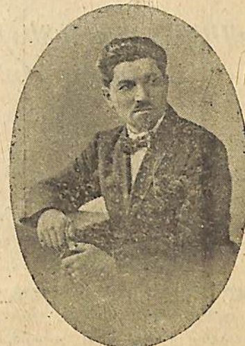
Ս. ԲԷԳՉՍԵԱՆ Հ. Ս. Խ. Հանրապետական Արտ. առևտրի ժող. կոմիտատ