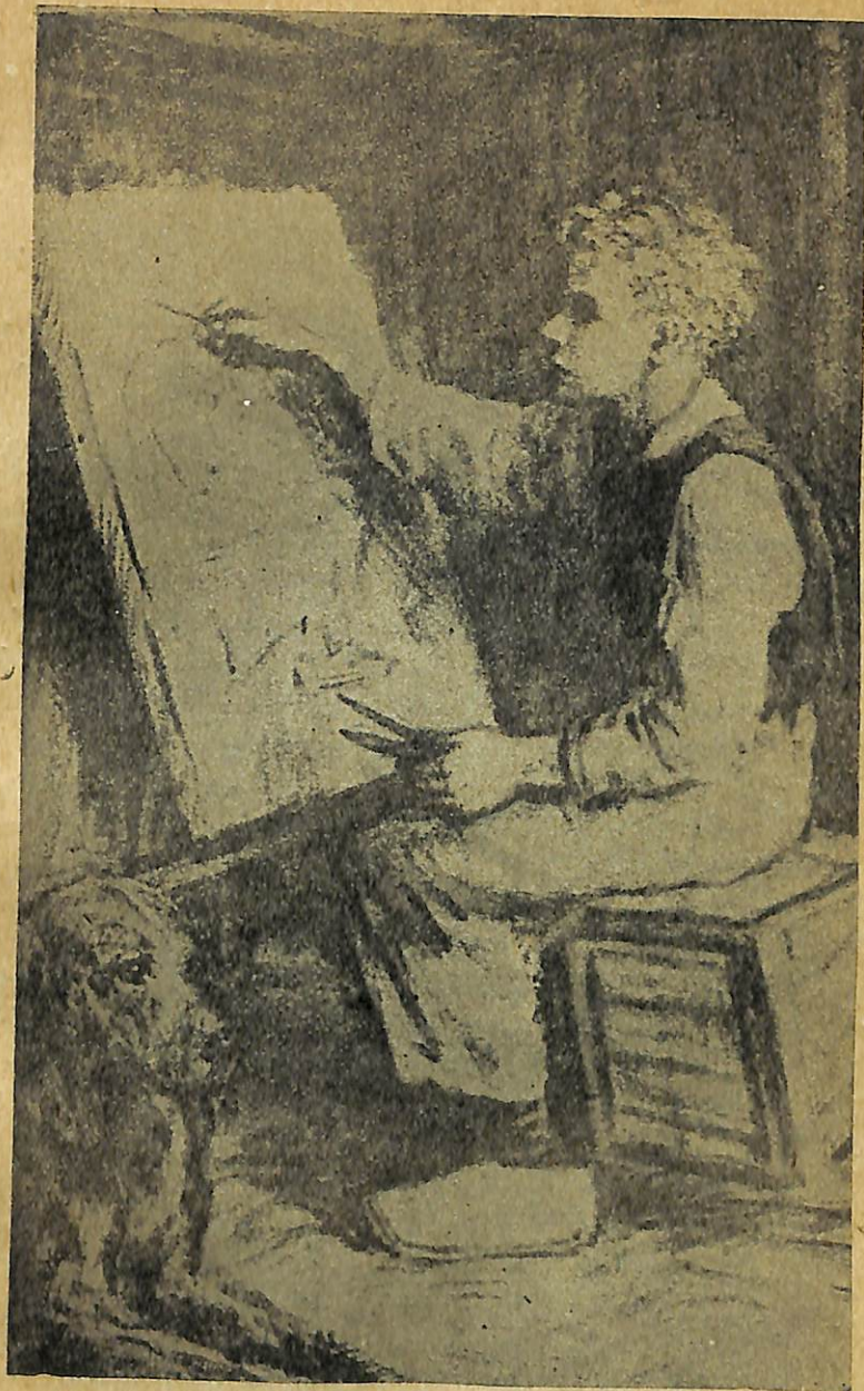
Ամբողջ գարունն, ամառն ու աշունը Նեյլոն աշխատում էր իր նկարի վրա:

Այնուհետև Նեյլոն պատկերացնում էր, թե ինչպէս աղջկանը կհագցնի թավչյա բաձկոն մօրթե յերիզներով և կնկարի նրա պատկերն այնպէս, ինչպէս Ռուբենսի նկարի վրայի ծերունին է նկարված: Հետո Պաարաչի