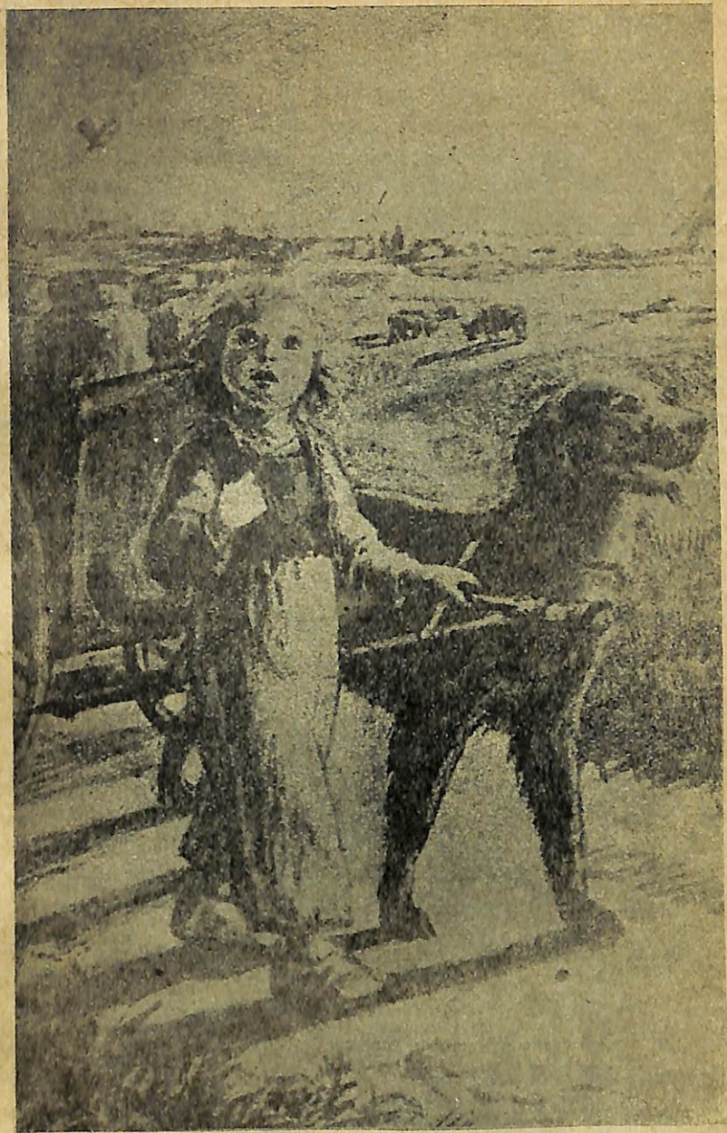
Նելլոն և Պատրաշը լավ ու համերաշխ եյին կատարում աշխատանքը:

Նելլոն և Պատրաշն այնքան լավ և համերաշխ եյին կատարում այդ աշխատանքը, վոր նույնիսկ ամառը, յերբ Դասսն իրեն ավելի լավ եր զգում, կարիք չկար, վոր նա՛ տաներ սայլակը: Նա կարող եր նստել դռների առաջ, ճանապարհ դնել նրանց իր հայացքով, յերբ նրանք դուրս եյին գալիս դարպասի դռնակից, իսկ հետո տաքանալ արևի տակ, մտածել վորևե բանի մա-