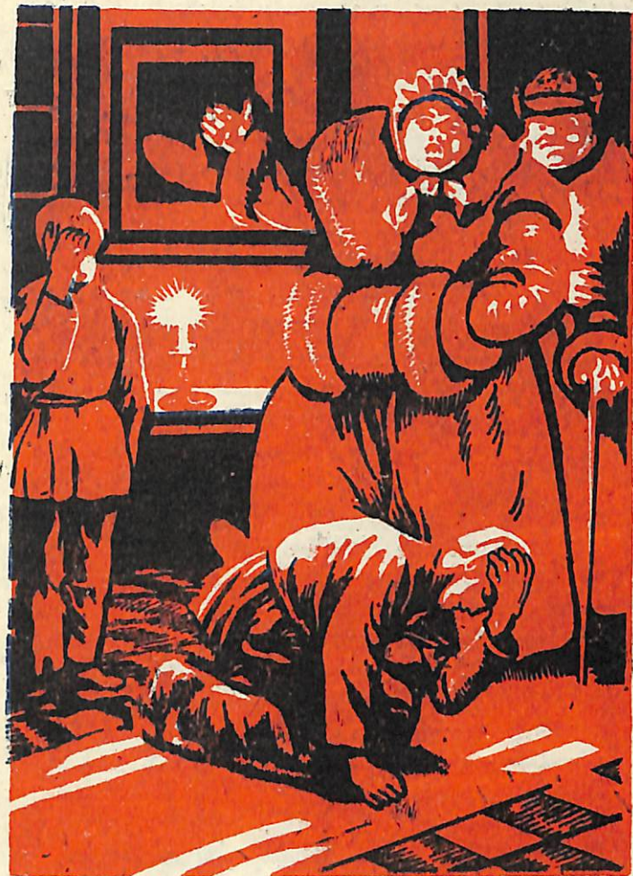
—Սերիկան.—Ուժեղ հարվածը գետին գորեց Վանյային:

—Մի տես, է,—ասաց Վանյան և վոչ միայն չերկրպագեց բոլոր չորս կողմերը, այլ թքեց:—Գիտես ինչ, —շարունակեց նա,—արի հրավառություն սարքենք: Յերևի մեր ջաղուն զեռ շուտ չի դա: