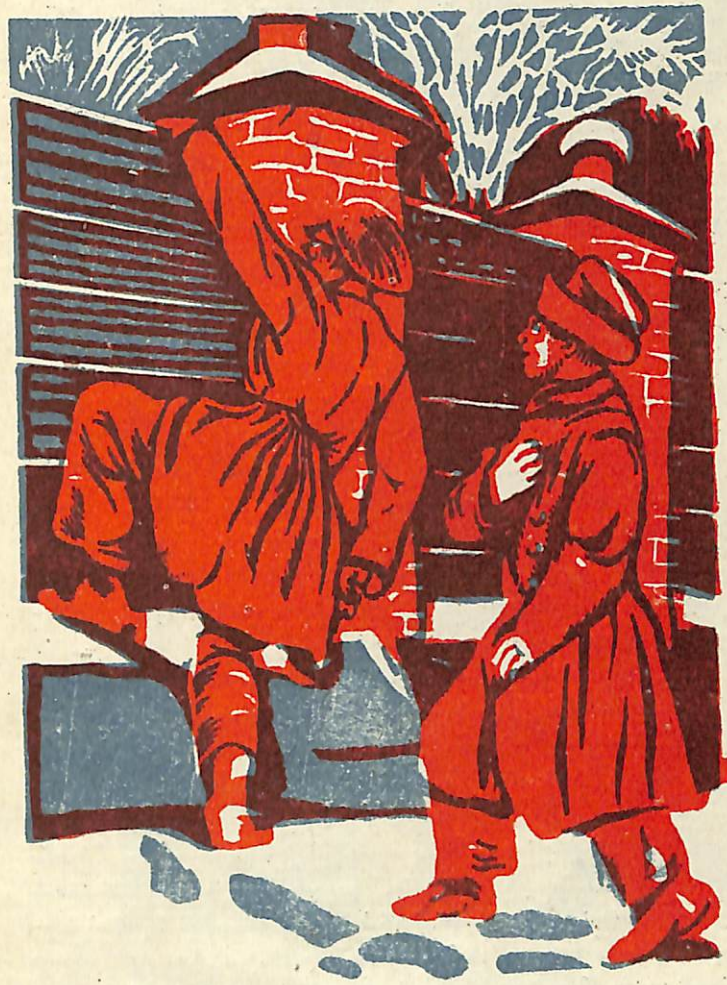
Նրանք զուրս յեկան բակը և ցանկապատի վրայով մագլըցեցին:

—Վոչ, չենք վառել,—հազիվհազ շշնջաց Միշան: