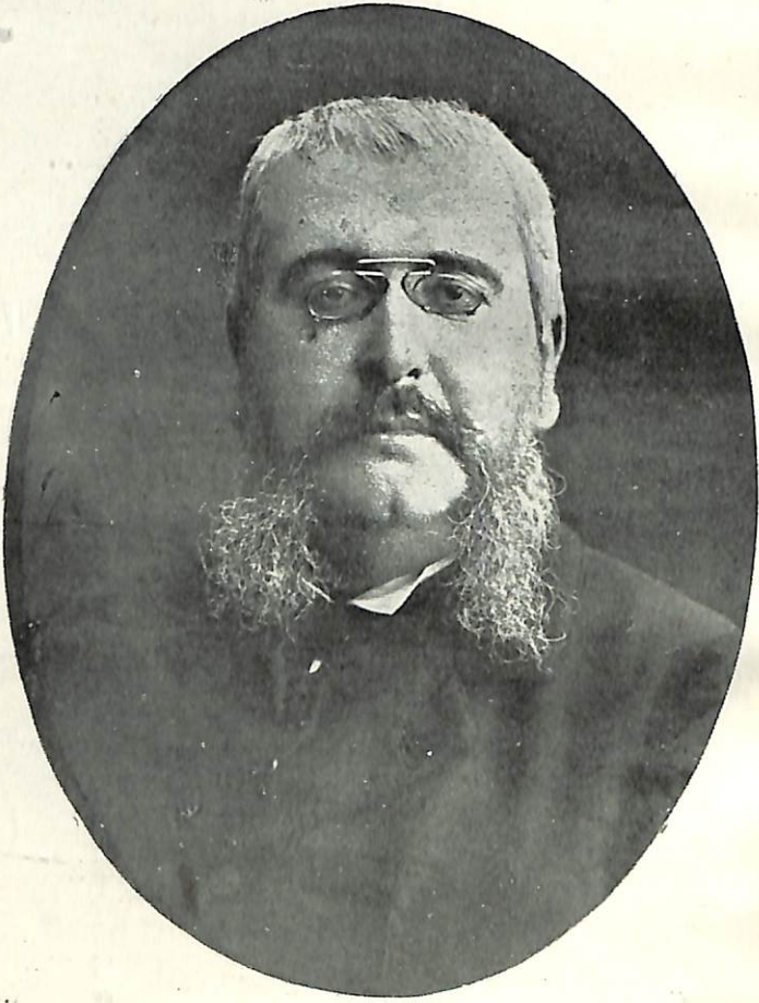
Ֆ. ՏՐ ՊՐԷՍՆՆՍԷ