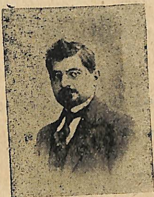
ՏՕԲԲ. Թ. ԹԱՇԱԵԱՆԷ