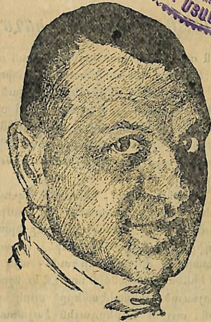
ԸՆԿ. Ա.Լ. ՄԱՐՏՈՒՆԻ

ՀԱՅԱՍՏԱՆԻ ՀԱՆՐԱՅԻՆ ԳՐԱԳՐԱԿԱՆ ՍՏՈՒԹՅԱՆ ՀԱՅՏՐԱԿԱՆ ԲԻՈԼՈԳԻԱ 7/31-1922 ՍՅԱՆԿՈՒՄ ԿՆՏՆԱԿԱՆ ՍՅԱՆԿՅԱՆԻ ԱՆՎԱՆ