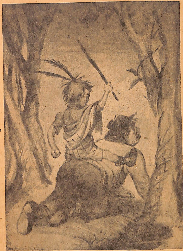
Կարմրամորթների առաջնորդը հեծել էր Բիլլին:

Նախաճաշից հետո տղան գրպանից կաշվի մի կտոր