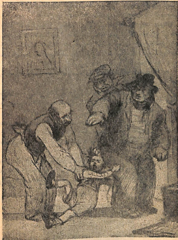
Տղան տղուկի նման կպավ Բիլլի վոտքերից: