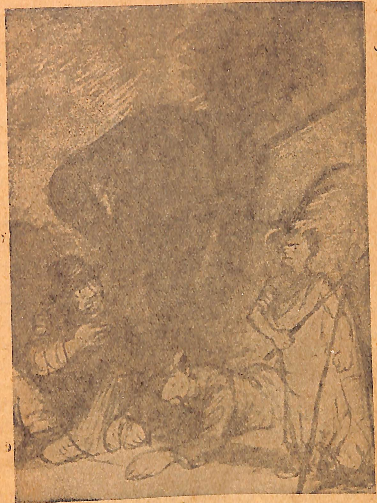
Սկսեցինք շարադրել նամակը:

Հանկարծ նրա աչքերում բռնկում ե մի արտահայտու-