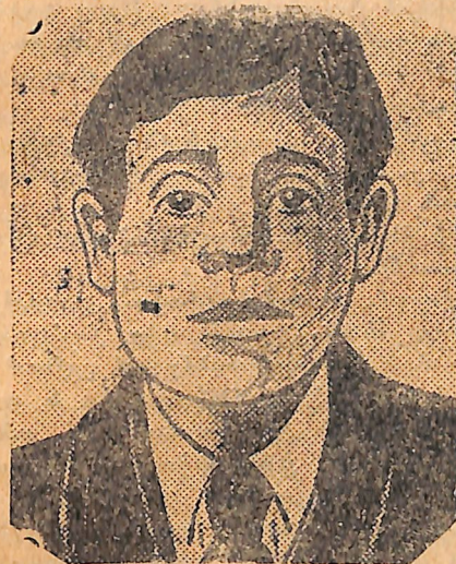
Կամոն 1905 թվին

յերկաթուղիները: Գործադուլ հայտարարեցին նաև տպարանները, լրագրները դադարեցին լույս տեսնել: Գործարանները, ֆաբրիկաները, հիմնարկութիւնները, դպրոցները ե նույնիսկ մանր արհեստանոցները