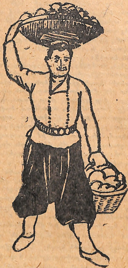
Կամոն կինոայլի հագուստով:

Մի շաբաթ հետո, հոկտեմբերի 1-ի տոնին՝ յես հագա նոր չերքեզկա, ներկեցի մաղերս և դնացի կայարան՝ ինձ ուղեկցող բուլչեիկյան կաղմակերպու-