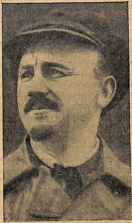
Ընկ. Ն. Բուխարին

հարցը—և ուրիշ մի շարք պակասութուններ և բացեր, վորոնց դեմ մենք հերոսական պայքար ենք մղում: