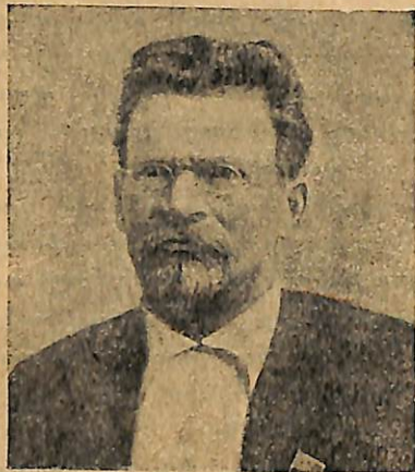
Ընկ. Մ. Կալինին

Յերկրի տնտեսական դրուժյունը կարգավորելու բու- րոր փորձերը մեկը մյուսի յետևից տապալվում էյին հենց նրա համար, վոր իրենց սոցիալիստ անվանող մանր-բուրժուազիայի ներկայացուցիչները վոչ մի հանդուգն քայլի չէյին համարձակվում դիմել: Նրանք