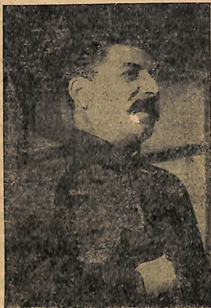
Ընկ. Ի. Ստալին

հայտարարել, բժիշկները մեծ մասը չեն ուզում բժշկել, ուսուցիչները չեյին ուզում սովորեցնել, յերբ բանկային ծառայողներն, իրենց հաշիվները թողած, հեռա-