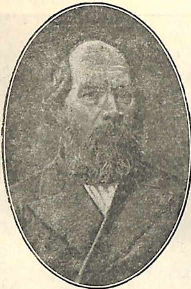
Իլյա Նիկողայիվիչ Ուլյանով (Վ. Ի. Լենինի հայրը)

կանալի նրանց բացատրում եր գասերը և կիրակի օրերն առանց վարձատրութեան պարապում եր նրանց հետ, վորոնք հետ եյին մնում, վորոնց տանը վոչ վոք չկար վոր կարողանար բացատ- րել գասերը: Յե՛վ ներկայումս եւ նրա մի շարք հին աշակերտ- ներ՝ ծերացած, շատ ծերացած մարդիկ սիրով և ճնորհակա- լությամբ են հիշում նրան: Նա աշխատում եր Սիմբիրսկում չքավորների, գյուղացիների յե- րեխաների համար ավելի շատ դպրոցներ ստեղծել, չինայե- լով իր ուժերն ու աշխատանքը: Բոլորովին չինայելով իրեն, ա-