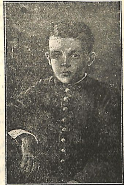
Վ. Ի. Ուլյանովը գիմնազիայում