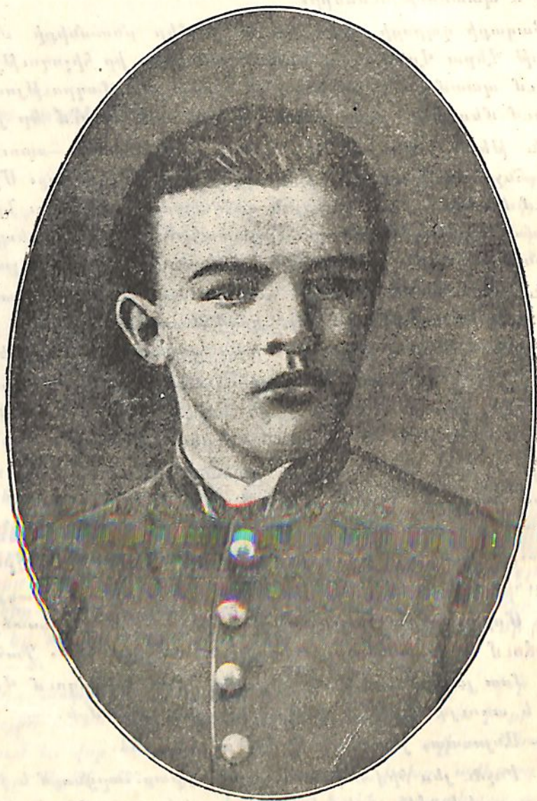
Վ. Ի. Ուլյանովը զինադիպի վերջին դասարանում

— Հապա գնա խոհանոց, կտրիր մի մեծ կտոր հաց, լավ աղ ցանիր ու կեր: