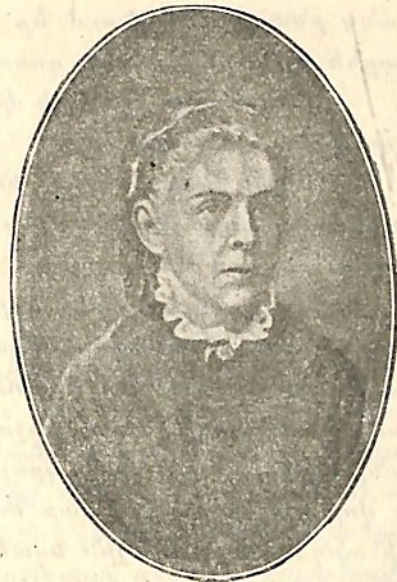
Մարիա Ալեքսանդրովնա Ուլյանովա (Վ. Ի. Լենինի մայրը)

Նրանք յերկուսն ել շատ աշխուժ և առույգ յերեխա- ներ եյին, սիրում եյին խաղալ ու վազվզել: Այդ բա- նում հատկապես աչքի եր ընկնում Վալուդյան, վորը սովո- րաբար հրամաններ եր տալիս քրոջը: Այսպէս, նա կատի- պեր Ուլյային՝ մտնել դիվանի տակ, վորից հետո հրամայում եր՝ «դիվանի տակից քայլով մա՛րը»: Ամենուրեք առույգ ու աղ- մրկարար Վալուդյան մինչևիսկ այն շուգենալի վրա, վորով նր-