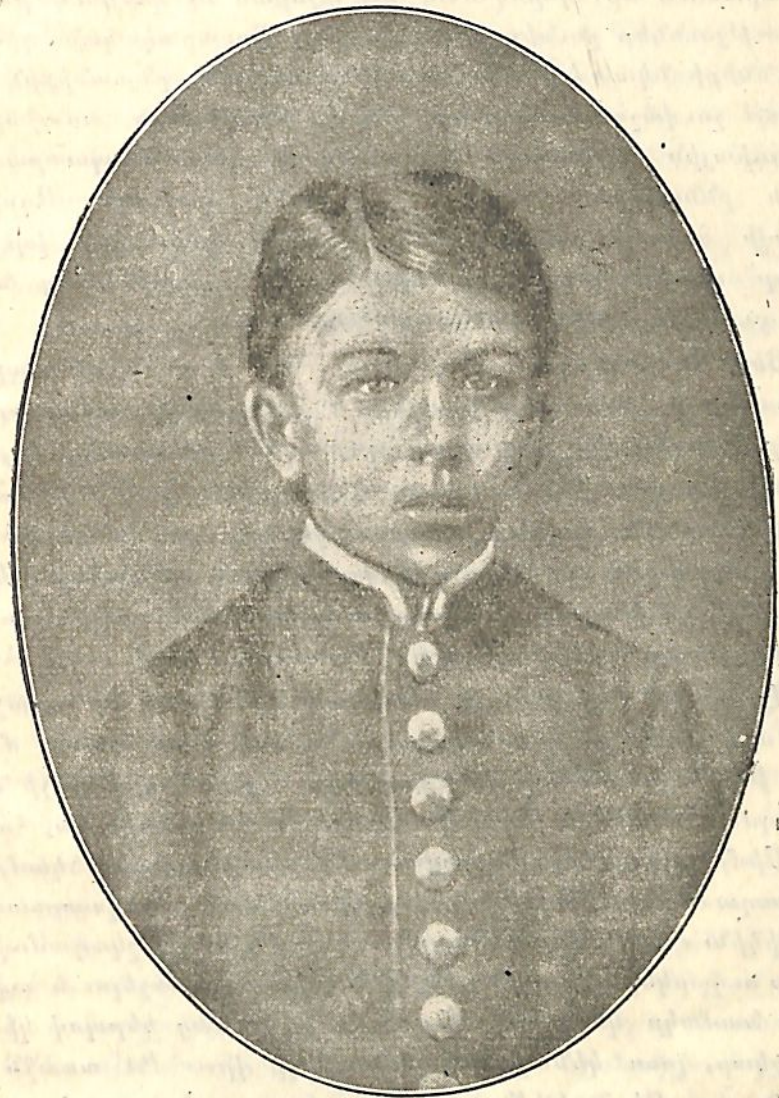
Ալեքսանդր Իլյիչ Ուլյանովը 1878 թ.

Այդ ուսուցիչը ծագումով չուվաշ էր և չուվաշական զրպրոցումն էր դասավանդում: Նա խոշոր ընդունակություններ ունէր մաթեմատիկայի ասպարիզում: Նա մաթեմատիկա յեր սովորել ինքնուրույն կերպով և ցանկանում էր շարունակել այն: Բայց համալսարան մտնելու համար հարկավոր էր զիմնագիտյի ավարտական քննություն տալ, քննություն տալ բո-