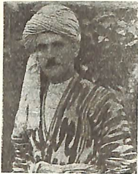
Մ Ռ Ա Յ Լ