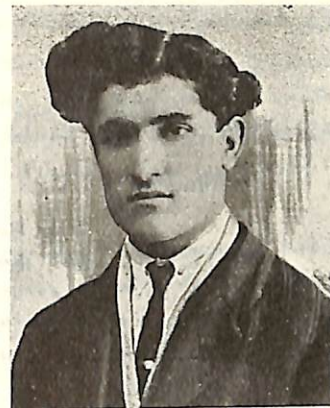
Ս Ր Ա Պ Ի Ո Ն