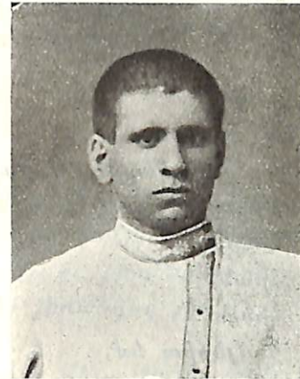
Ա. Ն Ո Յ Ա Ն