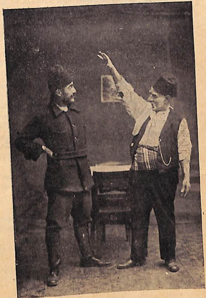
Գինեպան Սէրջօ՝ յեղափոխականի կը վերածէ անգործ Մեռօնսըզ Թումիկը, եւ գայն կը մկրտէ ԸՆԿՅՐ ԽՈՒՆՈՒՈՒՆԻ

Միհրդատ եւ Սաղաքիւլ.— (Ոտքի ելլելով, յար- գալիք, տեղ կը բանան Թումիկին) Հրամայե՛ք, հը- րամայե՛ք... (Այս միջոցին ներս կը մտնան Ա., Բ., Գ., Դ. յաճախորդները, որոնք երկու խումբ եղած՝ կը տեղաւորուին և օղի կ'ապսպրեն):