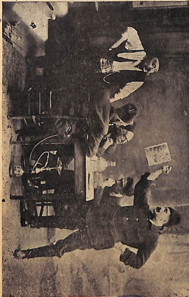
ՄԵՌՈՆԱԸՋ ԹՈՒՄԻԿԻ Եղափոխական վերածուել վերջ՝ իր սուտ ներստեղծումները պատմած պահուն

ՊԵՏԱԿԱՆ ԳՐԱԴԱՐԱՆ Гос. Библиотека ՀՍՄՌ-ԿՈՄ ՍՍՐ И. А. Мясоедов Ա. ԿՈՍՏԱՆԲՈՒՅՆԻ ԱՆՎԱՆ