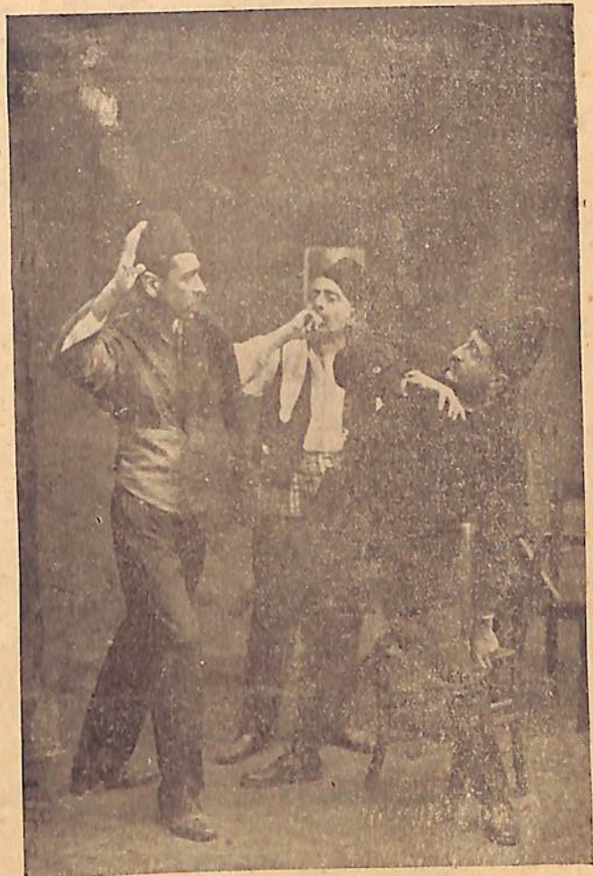
ԵՐԿԱԹԱԳՈՐԾ ՏԱՅԻ ՅՈՒՍԷՓ ղիմակազերծ կ'ընէ կեղծ հերոսը եւ կ'ապտակէ