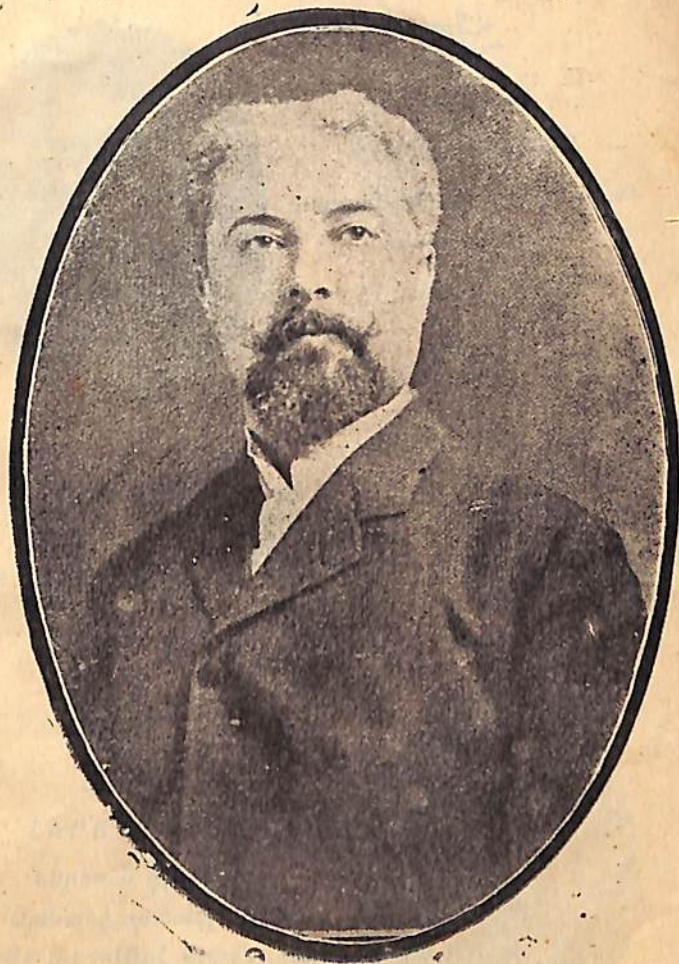
Յաւէտ ողբացեալ ազգային նահատակ եւ ազգային բարերար ԱՆՄԱՆ ՅՈՎ. ՀԱՆՆԷՍ ԹԱՆԵԱՆՁՅԱՆ

ՀԱՅԿԱՆ ԳՐԱԴԱՐԱՆ Гос. Библиотека ՀԱՍՈՒ-ԱՐՄ ԵՍՐ Մ. Ա. ՄՅՈՒՅՅԱՆԻ Ե ԳՐԱԴԱՐԱՆ ԵՄԿԱՆ