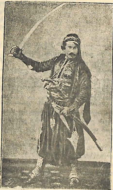
Ձեյթունցիի իր սարագով

Մեր տղաք, ուխտած էին կրակե՛լ, կրակե՛լ, կը- րակե՛լ թշնամիին վրայ՝ մինչև որ ծակ ծակ ըլլար շի- րենց մարմինը... իրենց խելայեղ ու տեւական վազ-