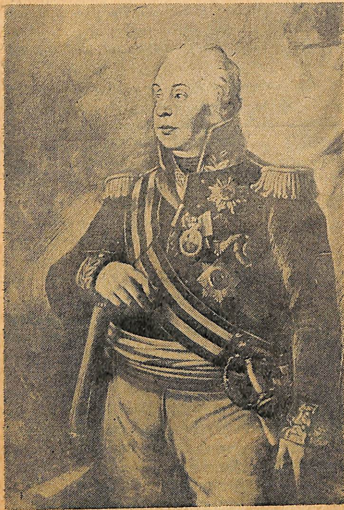
Գեներալ Մ. Ի. Կուտուզով

Հանդիսանում էր նրա աջ թևը: 1790 թ. Սուվորովը միայն Կուտուզովի մեծ աջակցության և հերոսության շնորհիվ կարողացավ հալանի Իզմայիլով բերդը գրավել: Այդ ճակատամարտի վերաբերյալ Կուտուզովի մասին Սուվորովն ասում էր՝ «Գեներալ Կուտուզովը գանվում էր մեր ձախ թևում, բայց նա իմ աջ թևն էր»: Իզմայիլով բերդի գրավման գործում Կուտուզովի մատուցած ծառայության համար Սուվորովը նրան նշանակեց Իզմայիլով բերդի առաջին պարեառ: