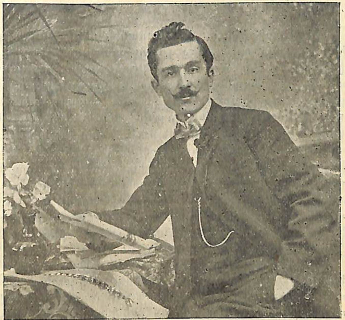
ՅԱՐՈՒԹԻՒՆ Ս. ԵՆԶՈՒՊԵՆՆ