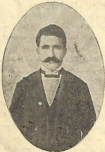
ԳԱՂԱՓԱՐԱՆՈՒԷՐ ԲԵՐՈՎԲԷ ԵՍՂՈՒՊԵԱՆ

Թշնամւոյն գնդակը եւ գետնայարեց Ձեր ճիւղանի հասակը։ Ուսուցիչ դպրոցի մէջ, ՈՒՍՈՒՅԻՉ եղար եւ մարտի դաշտում ըլլալով միակ յարացոյցը այդ մեզի ու վեհերոտ գիւղին՝ Ատանայի դաշտին բովանդակ։ Թող Ինձիրլիի ապագայ սերունդը յիշէ քեզ՝ իբր իր գիւղի Հայ դպրո- ցին, եկեղեցւոյն ու Հայ պատւոյն միակ պաշտպան Հե- ՐՈՍԸ։ Ապագան Ձեր քաջ ու հերոսի պատուանունը թող անմահացընէ սերունդէ սերունդ, կանգնելով Ձեր կճեայ արձանը դաշտին ի ձեռին խուժանին դէմ սպառնացայտս եւ Ինձիրլուի սերունդը թող ուխտի գայ ամէն օր ար- ձանիդ առջեւ յարգանքի մեծ պարտականութիւն մը կատարած ըլլալու գոհունակութեամբ, ու թող սարսու- լիւր ակնածանքով մը խոնարհի Ձեր յիշատակին առջեւ ։ Հանգիստ Ձեր աճիւններուն եւ յարգանք Ձեր յիշատակին։