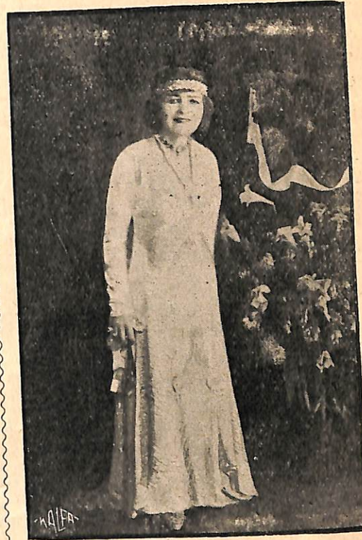
24 Սիրանոյշի վերջին լուսանկարը՝ Ալեքսանդրի Գամեկիազարդ Տիկինի դերին մէջ (1931):

1909 Յունուար 25ին Բագուի մէջ տօնուեցաւ Սիրանոյշի 35ամեայ յորեկեանի հանգէսը որան նկարագրութիւնը արտասուկով «Գործ» թերթէն կը ներկայացնենք ընթերցողաց, ցոյց տալու համար այն համակրութիւնը և արտասովոր յարգանքը որ Կովկասահայերը ունեցած են ստղանդաւոր դերասանուհիին: