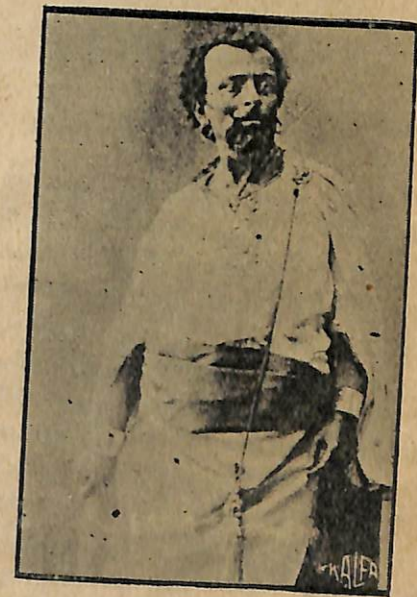
6 Ազամեան Օթելլօի մէջ: