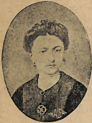
3 Արուսեակի վերջին լուսանկարը:

Արուսեակի վերջին օրերը լքումի և մտացու թեան շրջան մը եղաւ, սարիներով ապրելով Սկիւտար խեղճուկ հիւզակի մը մէջ, վերջին տարիները Ազգ. Հիւանդանոցի մէջ սրտասպարուեցաւ ուր մեռաւ 1907 ինչ որ անշուք դազալին ետեւէն ոչ մէկ հայ դերասան յուզարկաւոր գնաց, այս ամօթն ալ