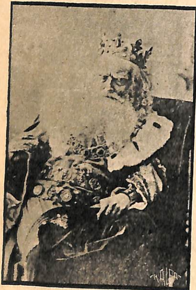
14 Ալոսեանի Լիւ Արֆայ:

Միրանոյշ (բուն անունով Մէրօպէ Գանթարձեան) ծնած է 1862ին Պոլսոյ