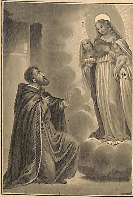
Տեսիլք Տիրամօր առ Մխիթար:

Աստուած էր զինքը զրդողը, հեռու էր բոլորովին փառասիրութեան, յանձնապաստանութեան զգացումներէ. ընդհակառակն իր յատուկ խոնարհութեամբ՝ ոչինչ ու անկարող գործիք մը կը ճանչնար ինքզինքը Աստուծոյ ձեռքին մէջ, և անդադար կը պաղատէր որ Աստուած ինքը յարուցանէ կարող անձ մը որուն ձեռքին տակ ամէն անձնանուէր եռանդեամբ ու հպատակութեամբ աշխատելու պատրաստ էր ինքը: Ի զուր այս դիտմամբ դիմեց զանազան վարդապետներու և եպիսկոպոսներու, որոնց աստուածսիրութեան ու գիտութեան համբաւը իրեն յոյս մը կու տար որ կարենայ իրեն նեցուկ ունենալ զանոնք: Ի զուր երկայն ժամանակ դարձեալ թափառեցաւ Հայաստանի և Փոքր Ասիոյ ամէն կողմ, և մինչև իսկ Պօլիս ալ եկաւ: Առաջարկեց Մարգար եպիսկոպոսին, որ իրեն վարդապետական գաւազան տուած էր, և խաչատուր վարդապետի՝ որ Հռովմէն եկած էր, իրեն գաղափարը և խնդրեց պաղատեցաւ որ անոնք յանձն առնուն նոր հաստատուելիք միաբանութեան մեծաւորն ըլլալ. բայց անոնք՝ գովելով հանդերձ իւր եռանդը, փոխանակ օգնելու՝ նոյն իսկ կը ջանալին զինքը ետ կեցնել այդ գործէն՝ վհա-