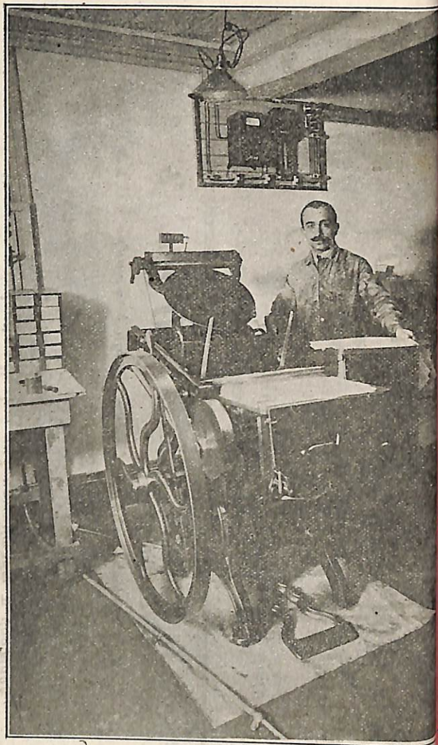
«ՀԱՅՐԵՆԻՔ»Ի ՁՆՈՒՐԻ ՄԵՔԵՆԱՆ