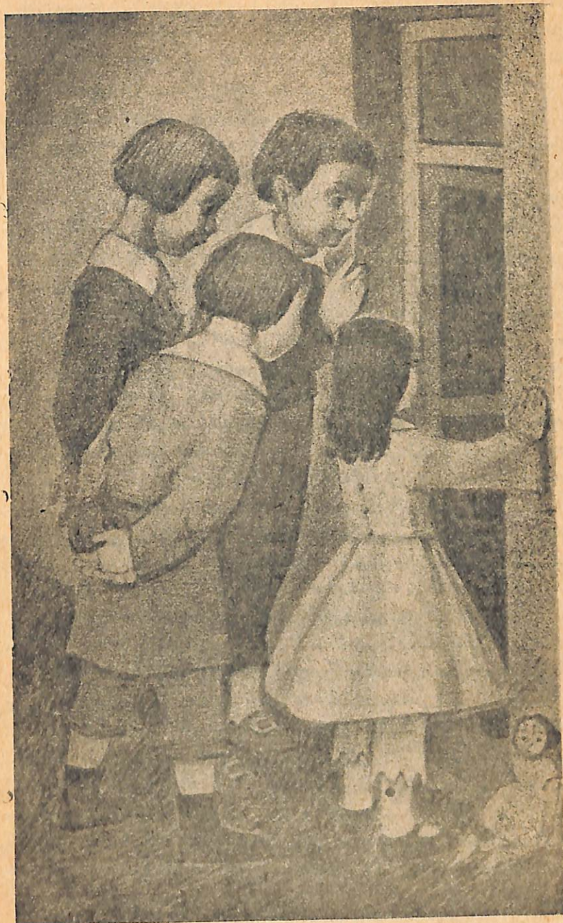
Ջուսամուտի առաջ կանգնած, մենք սարսափած սպասում էլինք, թե ինչ պիտի լինի:

Մի անգամ, յերբ նա ամբողջովին խորասուզված էր սափրվելու գործողության մեջ և, քթի ծայրից բռնած, լեզվով գուրս էր հրել սափրվող այտը, մեծ յեղբայրս ողանցքի միջով յետ արեց լուսամուտի փականը, զգուշությամբ իջավ սենյակն ու բացեց մուտքի դուռը: Այդպիսով, ապահովելով իր նահանջի ճանապարհը, նա սկսեց ինչ-վոր