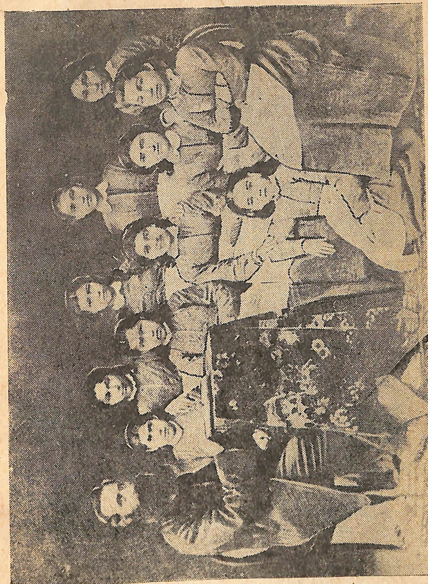
Պ. Ա. Ղ. Ս. Յ. Ն. Ե. իր մի խումբ անդամների հետ (Արևմտահայաստան)