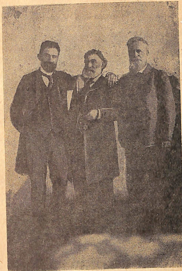
Հ. ԹՈՒՄԱՆՅԱՆ, Պ. ՊՈՒՇԵՍՆ ՅԵՎ Ղ. ԱՂԱՅԱՆ

Նախ նկատենք, վոր 19 և 20-րդ դարերի հայ գրողներից ու մանկավարժներից թերևս վոչ վոք այնքան շատ ու այնքան նվիրվածութեամբ չի զբաղվել լեզվի ու լեզվաշինարարութեան հարցերով, ինչքան Աղայանը: Նա մի քանի տասնյակ հոգվածներ ու մի քանի բրոշյուրներ և զրել հայոց լեզվի պատմութեան, բարբառների ու գրական լեզվի, նրանց զարգացման խընդիւրների և մասնավորապէս ուղղագրութեան ու մայրենի լեզվի ուսուցման մեթոդիկայի հարցերի շուրջը: Լեզվի վերաբերյալ Աղայանի գրածները յեթե ի մի հավաքվեն, կկազմեն մի մեծ հատոր: