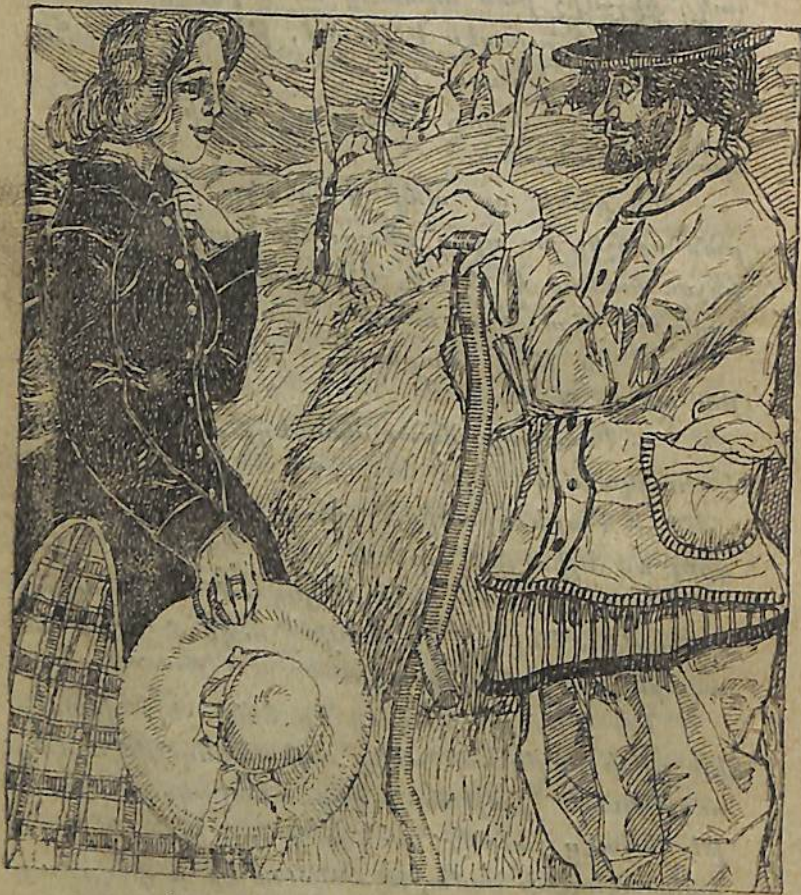
Նա նիշա խտանարքին եկաւ...

կացաւ: Ամեն ինչ խելացիօրէն կշռադատելով Իսահակը անհրաժեշտ համարեց, որ որդին նո- րից զանա տան գլխաւոր անդամներէց մէկը և, որպէս ազամարդ, մասնակցի աշխատանքներին: