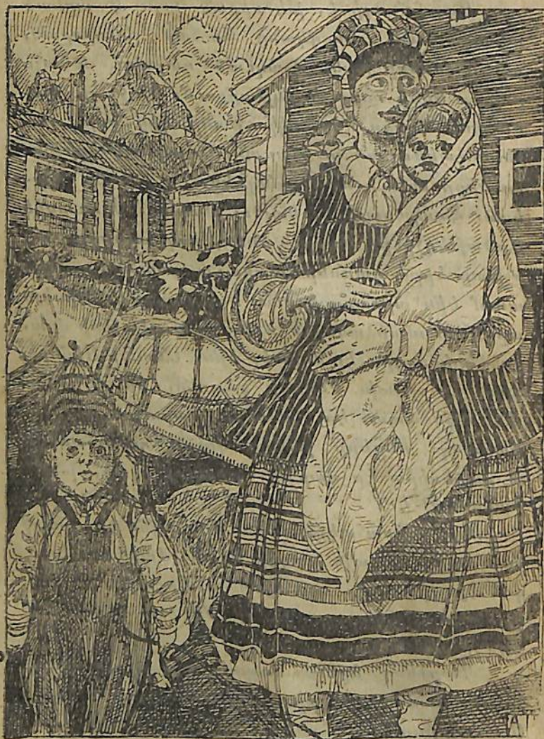
Ելիսէյն արդէն համարձակօրէն ման էր գալիս ոտի վրա...

լով նրա Սիվերա քեռու հարստութեան մասին, նկատում է՝