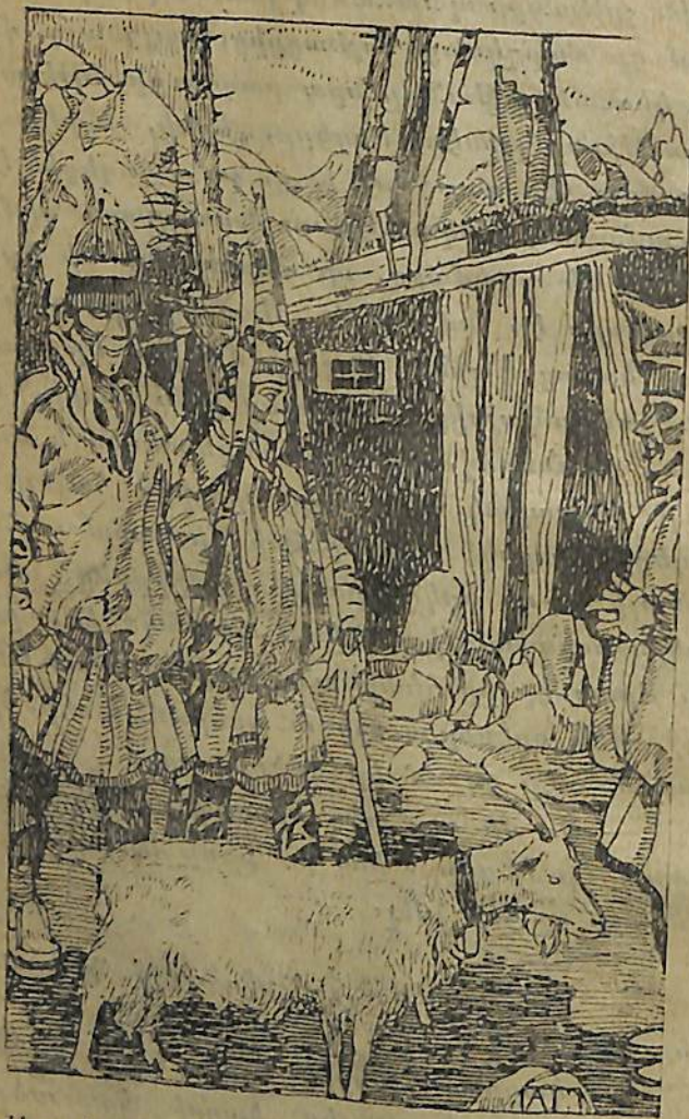
Այդտեղով անցնող թափառաւորների լոպարը տեսաւ այժր...

պած մի մեծ գերան քաշ տալով՝ տուն վերագարծաւ: Կապիտ ու պարզամիտ Իսահակը ոչժերը լարած ազմուած էր գերանով, ոսներով, հագում, որպէսզի կինը անից դուրս գա ու վարմանա իր վրա: