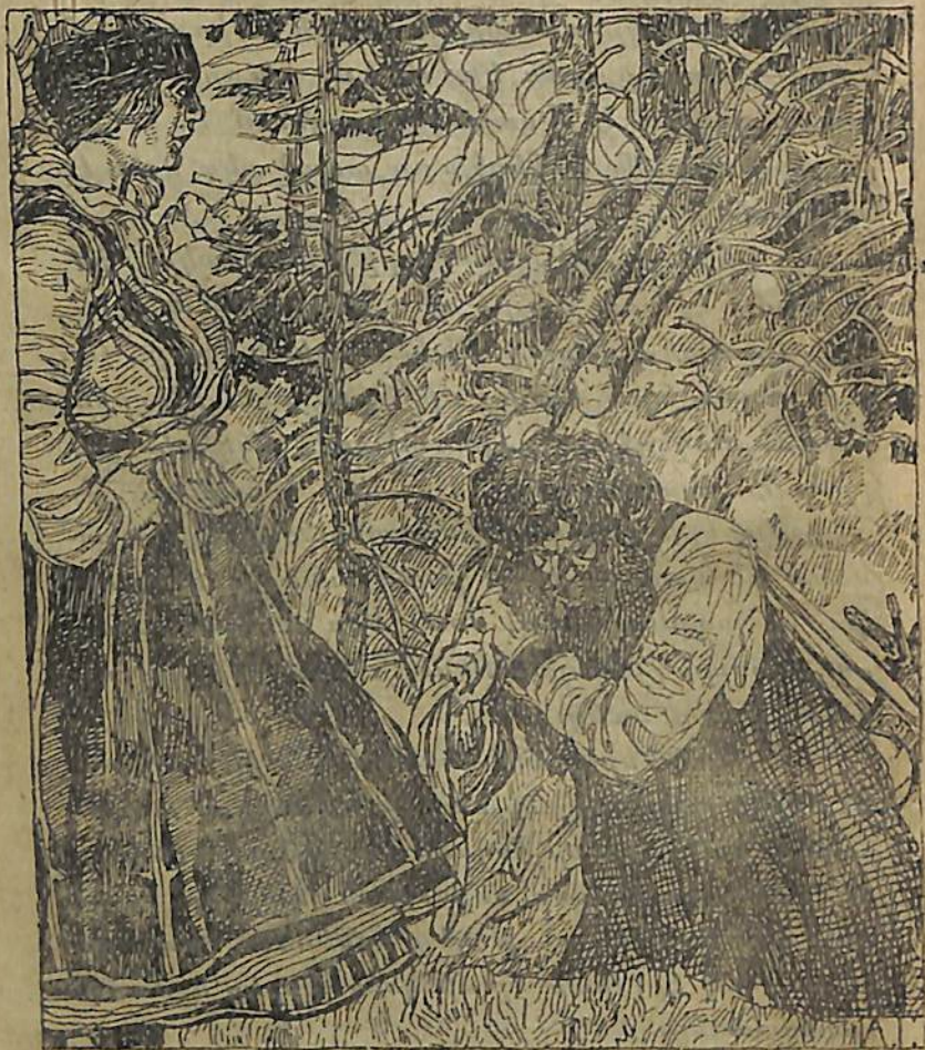
Երեկոյեան նա տուն վերադարձաւ...

— Ինձ համար չորս արշին չի՞ կրերես, կանչեց նրա յեռեկոյ Իսաբերը։