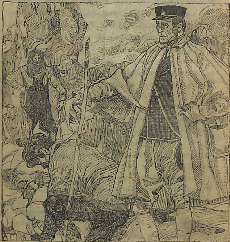
Նրանք Իսահակի հետ դէպի ժայռերը գնացին...

— Հա, ապա ա՛յն, որ Օս-Անդերսը տաւրտ, ա՛յ, նրա հետ միասին տասը կլլինի: