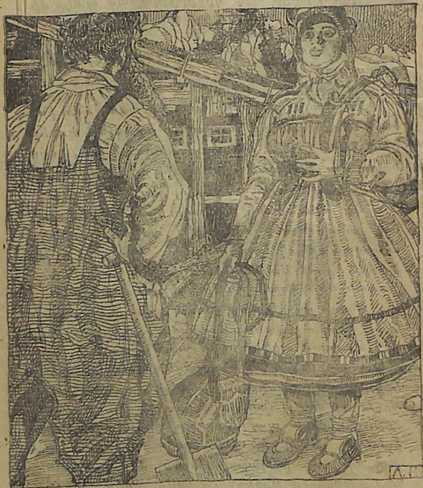
Եւ, վերջապէս, մէկ անգամ կին — օգնականը յայտանայ...

— Ի՞նչ անուն տալ քեզ, հարցրեց Իսահակը, աւելի համապատասխան մականուն, քան Արծաթեղջիւր, չի կարելի գտնել: