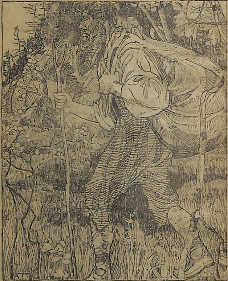
Նա դէպի փախ է գնում...

որ նշանաւոր մարդիկ են եկել այս ամառի տեղում ապրելու (չէ՞ որ լուսարները միշտ էլ շոգորթում են)։