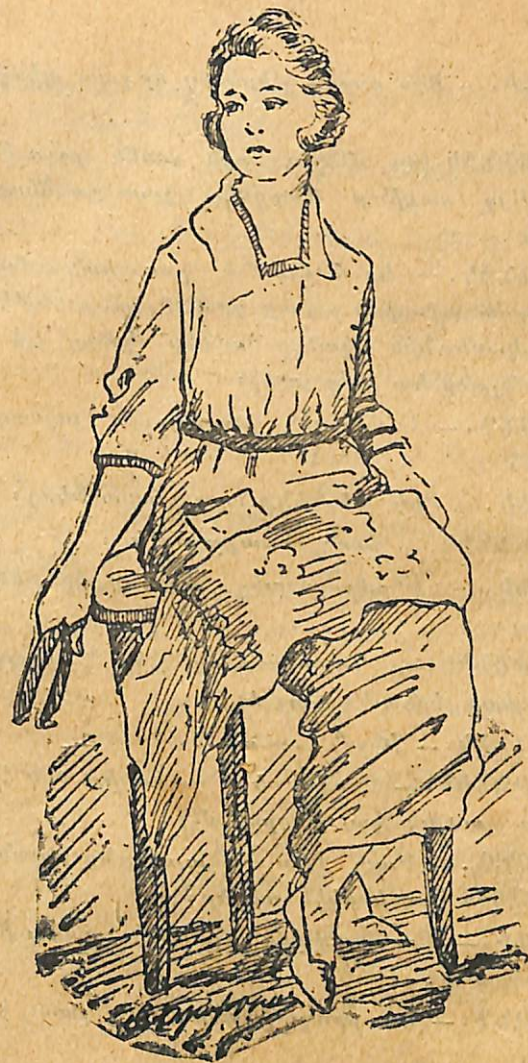
ՕՐԻՈՐԴ ԱՇԽԷՆ (Կարունի)

ՀՐԱՆԴ.—Շատ աղտոտ միջոցներու: Պարզապէս վարկաբեկիչ լուրեր սկսած է տարածել տօքթորին մա- ին և այդ լուրերը հառած են տօքթորին ականջը որ, բարկացած: ուզած է իր հակառակորդէն վրէժ լուծել: Եւ ահա՛ հիմա այդ երկու նախկին բարեկամները կա- տաղի թշնամիներ եղած են: