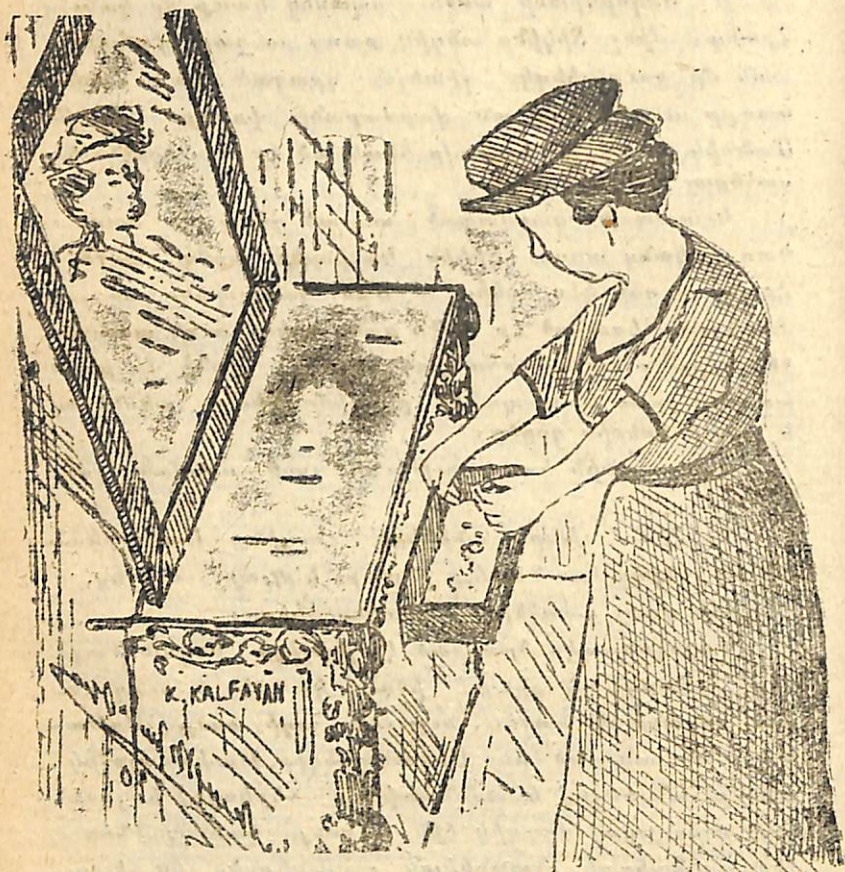
ՏՐԿԻՆ ՄԱՆՆԵԻԿ ԻՐ ԱՐԴՈՒԶԱՐԴԻ ՍՐԱՀԻՆ ՄԷՋ

ԿԱՌԱՊԱՆԸ. — Հիմա պարոն մը և տիկին մը եկան հոս, շատ կարևոր ըսելիք մը ունիմ, պէտք է տեսնամ զիրենք: