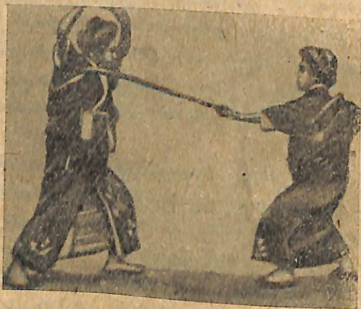
Նկ. 1. Յապոնացի կանայք զբաղվում են սպորտով:

Այդ նրբափողոցները լի յեն միհարկանի և յերկհարկանի տնակներով: Տնակները պատուհան չունեն, իսկ նրանց առջևի պատերը միշտ ներս են քաշված: Յերբ անցնում ես այդպիսի նրբափողոցով, տեսնում ես միայն պատերի շարանը, տախտակե շրջապատն: Ըր և նրանցից դուրս ցցված ծառերը: Ահա մի այդպիսի յերկհարկանի տուն: Նրանում ապրում է միջին կարողության տեր բուրժուական ընտանիք: Տեսնենք, թե ինչպես է այրում նա: