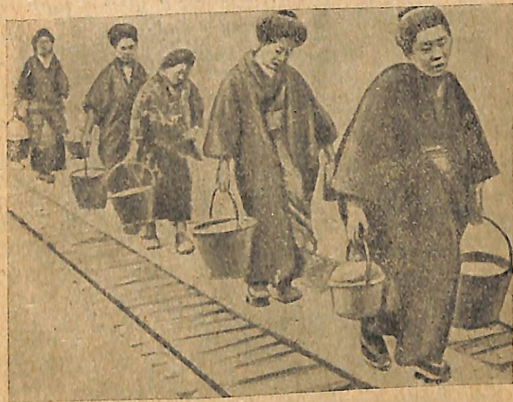
Նկ. 5. Յապոնական գեղջկուհիները քաղաքից տանում են թափթփուկներով դուլերը՝

րում և գործարաններում: Մյուս կողմից, արդեն գործարանում աշխատող բանվորը յերբեմն, արդյունաբերության դադարման և ձեռնարկության փակման շնորհիվ ստիպված է նորից գյուղ վերադառնալ և փնտրել այնտեղ վորևե սպաստարան ու սնունդ: Ստացվում է շատ կենդանի և ամուր կապ բանվորների և գյուղացիների՝ միջև, քանի վոր քաղաքը և գյուղը մշտապես փոխանակվում են իրենց