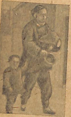
Նկ. 2. Չինական մուրացիկներ:

Չինական փողոցներում չափազանց շատ են մուրացկանները: Նրանք այնքան շատ են և այնքան վողորմելի, վորքան վոչ մի այլ յերկրում: Յերբեմն այդ մուրացկանները միանում են հատուկ արտեղների մեջ և վորոշ տուրք են դնում խանութպանների վրա իրենց ոգտին: