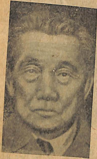
Նկ. 4 Յապոնական հայտնի կոմունիստ ընկ. Կատայամա:

Ընթերցումը ընդհատվեց: Յերեխաները կախ տվին պատից յապոնացիների պատկերները — յեվրոպական և ազգատից յապոնացիների պատկերներ — կիլին տարագով հազնված յապոնուհիների պատկերներ — կիմոնոյով և բոլոր այդ պատկերների տակ փակցրին փոքրիկ ծանոթություն՝ —