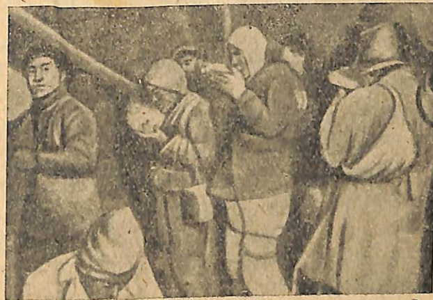
Նկ. 8. Սովալուկ չին կուլիներ: Քաղաքացիական պատերազմի հետևանքով զրկված են աշխատավարձից և ստիպված են մուրացիանություն անելու:

Գոմինդանի դահիճները գաղանդորեն չարչարում էին իրենց ձեռքը ընկած կոմունիստներին ու հեղափոխականներին: Թվում էր, թե հեղափոխութունը բոլորովին ջախջախված է: Բայց այնքան էլ հեշտ չէր համբերությունը կորցրած բազմամիլիոն բանվոր ու գյուղացի մասսաներ: շարժումը ընկճել: Վոչ միայն հարավում, Չինա տանի ավելի առաջավոր շրջաններում, այլև հյուսիսում — հա՛յա-հեղափոխական գեներալների թիկունքում — սկսեցին կազմակերպվել զինված գյուղացիական ջոկատներ «Պողպատե