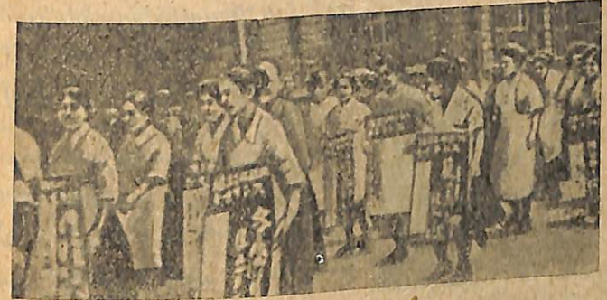
Նկ. 3. Գործադուլավոր տեկստիլ բանվորների ցույցը:

Յապոնիայի բանվոր դասակարգի բոլոր առողջ ու գի- տակից տարրերը վաղուց ի վեր ձգտում էյին կազմակերպ- վելու միությունների մեջ — իրենց դասակարգային շա- հերի և իրավունքների պաշտպանութեան համար: Ստեղծ- վեցին մեծ քանակութեամբ բանվորական միություններ, բայց յերբ ամբողջ Յապոնիայում ծավալվեց բանվորական գործադուլների և հուզմունքների շարժումը, կառավարու- թյունը սկսեց պայքար մղել պրոլետարական միություն- ների դեմ: