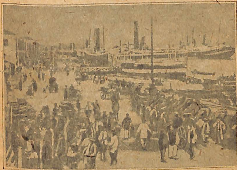
Նկ. 3. Շանհայի նավահանգիստը: — Ոտարյուրկոյա պետութիւնների ռազմանավերը:

ուտելիքից հետո տալիս են տաք թաց անձեռնոցիկներ, իորոնցով վորկրամուխները սրբում են ձեռքերը, գլուխն ու իզը: Մտնում են և դուրս են գալիս մանրավաճառները ըննց արկղներով և կոնակ քորոզները փոսակրից շինած իրանավոր մատներով: Հեռախոսում եք դեմի թեյարանը՝ այնտեղից իսկույն գալիս է փոքրիկ վայելչակազմ չիուհին պակաս գեղեցիկ ուղեկցուհու և ջութակահարի ետ: Յերեքն ել նստում են փոքրիկ աթոռների վրա և