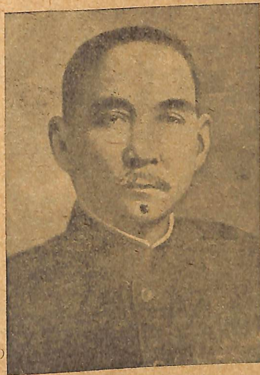
Նկ. 4. Չինական հեղափոխության հայրը — Սուն-Յաթ-Սենը:

պալատանման գրասենյակներում, բանկերում, գեղեցիկ վիլլաներում նստած եյին հոգսից ու անել սարսափից քարացած մարդիկ: Արդեն յերկար ամիսներ վոչ մի ապրանք չեր գնում Հոնկոնգից Չինաստանի խորքերը: