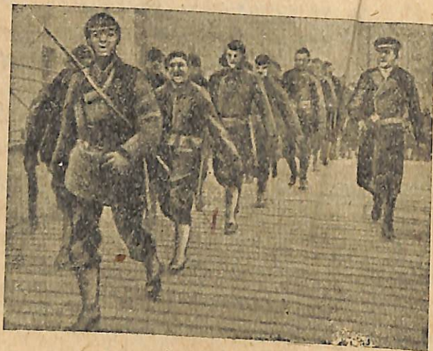
Նկ. 7. Ամերիկական կապիտալիստների վարձկանները դուրս են գալիս չին բանվորների և գյուղացիների դեմ:

միասին պայքարել ապստամբ բանվորների և գյուղացիների դեմ: Սկսվեցին հեղափոխական պրոֆմիլոթյունների, առաջավոր ուսանողության և մանավանդ կոմունիստական կուսակցության ներկայացուցիչների ձերբակալումները, գնդակահարումները, գլխատումները: Թշնամական քայլեր սկսվեցին Խորհրդային Միության ներկայացուցչության դեմ Պեկինում, Շանհայում, Կանտոնում: Մեր ներկայացուցչությունները շրջապատվում էին զորամասերով, թե չինական, թե յեվրոպական, նույնիսկ սպիտակ եմիգրանտներ