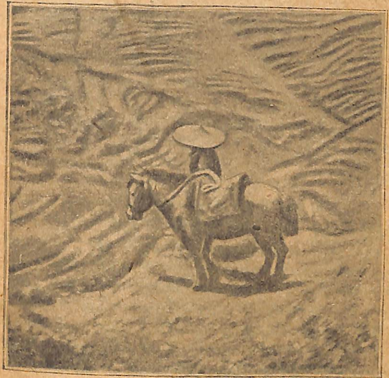
Նկ. 1. Թեյի պլանտացիա: Գյուղացին, ջորի հեծած, դիտում է իր արքը:

Չինաստանի բազմամիլիոն գյուղացիութեան հեղափոխական պայքարը նոր է սկսվել. անցնելով շարժման գլուխը, չինական բանվոր դասակարգը և նրա ավանգարդ — կոմունիստական կուսակցութիւնը կտանի չին աշխատավորութիւնը դեպի վերջնական հաղթանակ: