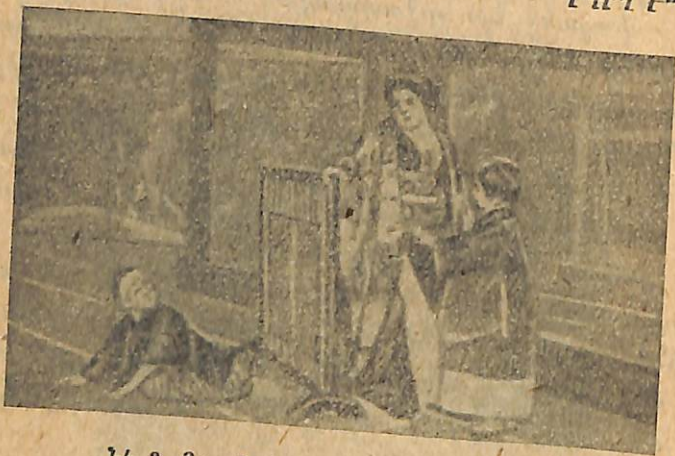
Նկ. 2. Յապոնական հարուստ տան ներքը:

Հատակը ծածկված է փափուկ հարդյա ծածկոցներով, վորոնց վրայով յապոնացիները քայլում են, վորոնց վրա նստում են, աշխատում և քնում: Սենյակներում վոչ աթոռներ կան, վոչ նստարաններ: Նստում են մարդիկ բարձերի