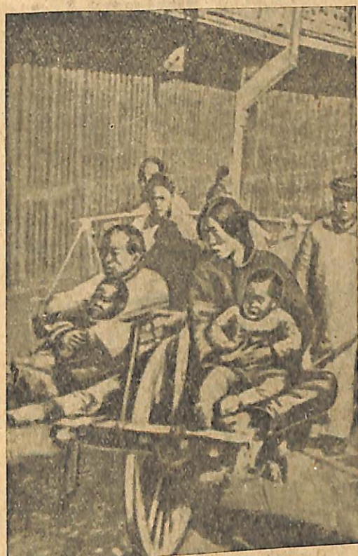
Նկ. 5. Հին չինական միանիվ սայլակի վորով տանում են յերեխաներով կանանց:

կանի տան մեջ, փոքրիկ սենյակներում, վոր նման են մկան ծակերի, ապրում են չորս ընտանիք, բաղկացած 40 մարդուց: Մենք այցելեցինք այդ սենյակներից մեկը, մոտ 1 քառակուսի մետր տարածությամբ, ուր ապրում են 10 մարդ: Նրանց կեսը քնում է գիշերային սմենայի