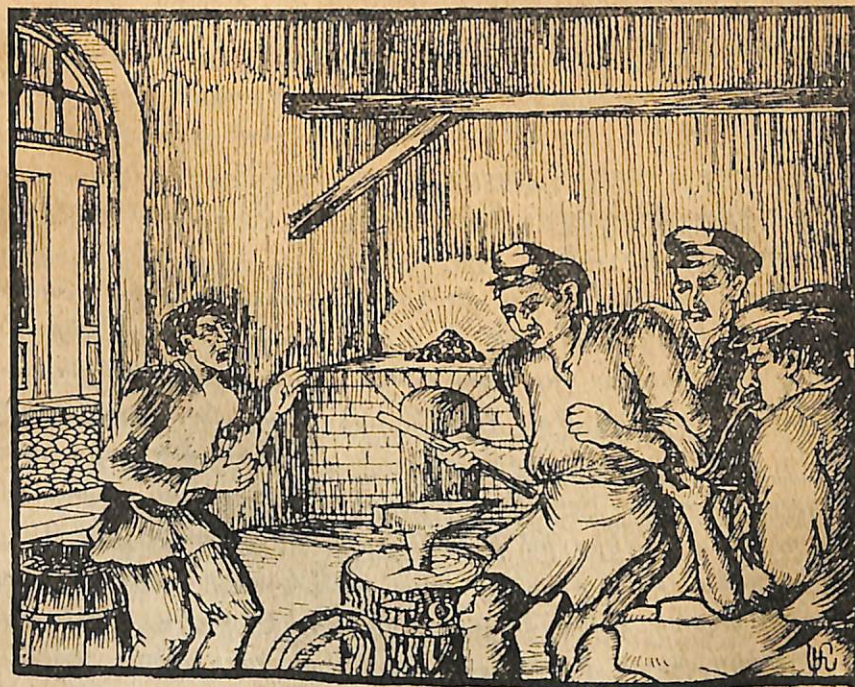
«Տեսնում ես, փորդ կկոխեմ, շան լակոտ, թե բերանիցդ բան ես հանել...»

— Տեսնում ես, փորդ կկոխեմ, շան լակոտ, թե բերանիցդ բան ես հանել տանը: