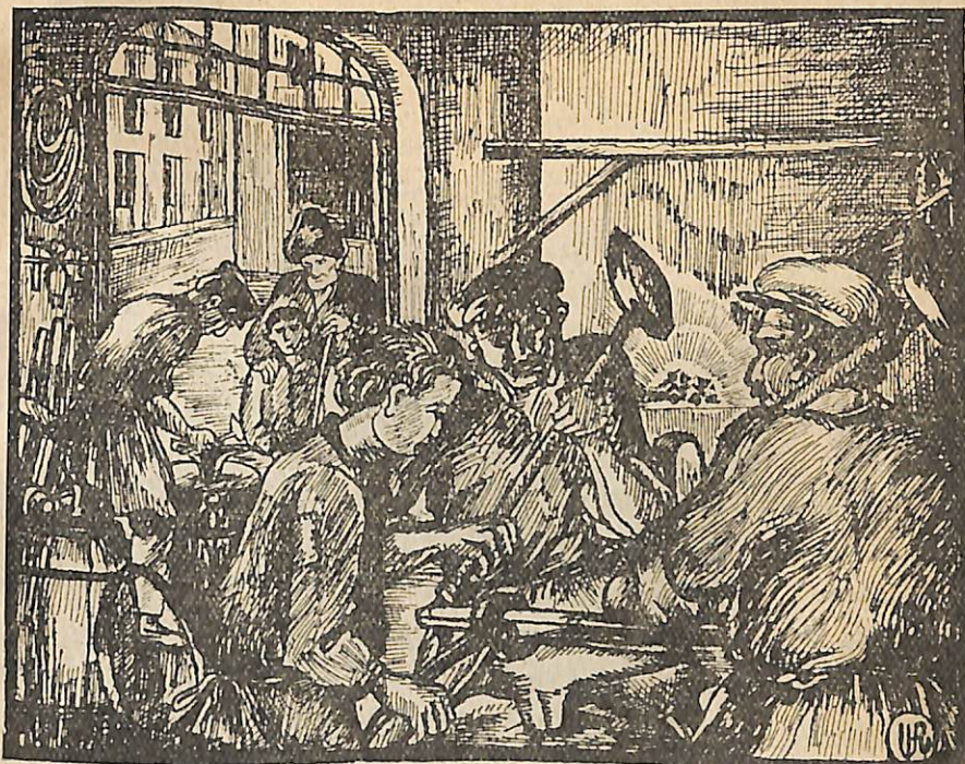
«Բաղալ ջան, սրանից լավ փեշակ չե ըլել այ վորդի...»

— Ուզում եմ ես յերեխին աշկերտ տամ, աշկերտ չի վերցնի՞ր: