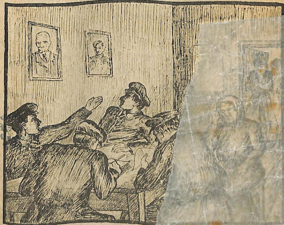
«Ուր ա հիմա Չարչոնց Ղազարի տղան, վոր... — Ուր են, են 35 ու 50 սրավար վարտ...»

Սրանից հետո բավական ժամանակ անցավ: Բաղալից ել խաբար չկար. գեղումն ասում էին՝ նրան Սիբիր են տարել, կորցրել: Քաղաքի «խառնակություններն» ել վերջացել էին ու գեղերումը դեռ բարձր էին խոսում ու հայհոյում Չարչոնց Համբոն ու իր նմանները: Բայց յերբ սկսվեց մեծ կռիվը, նրանից հետո յել Ռուսաստանի Մեծ Հեղափոխությունը՝ են ժամանակ ելի լսվեց Բաղալի անունը: Լրագրներում շուտ-շուտ եր գրվում նրա մասին. ու յերբ ենտեղի հեղափոխությունը կարմիր Բանակի հետ յեկավ մեզ մոտ՝ բոլորն