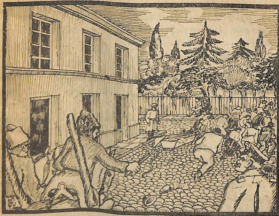
«Բաղալի գլխարկն ել մնաց այդ որը ձիերի վոտքերի տակ...»

Սոսնվում են հրացանի զարկերը. շփոթը մեծանում. ամբոխի միջից ել հատ-հատ ատրճանակի պատասխաններ են լինում, վորից հետո ծեծն ու խուճապը ավելի յե ուժեղանում և ամբոխը, իջնող ալիքների նման, կամաց կամաց հարվում և զանազան ուղղությամբ: Դատարկ հրապարակում մնում են՝ տեղ-տեղ ընկած սպիտակ թերթիկներ, սև-սև գլխարկներ և իրենք, ձիավոր կողակներն ու գործողովոյներ՝ սյունների պես բսած: Բաղալի գլխարկն ել մնաց այդ որը