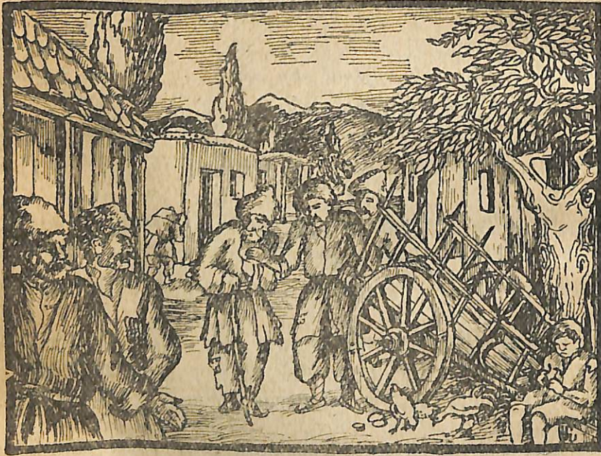
«Եզտ պատ պահեցէք, վոր... մեր հողերը կխլեն ձեզ տան... — Չե, դուք հանգիստ կացեք, վոր միշտ ուրիշները կաշխատեն, դուք ել կուտեք, պոռչներդ լպտաեք...»

Եստեղ ավելի բարձրացրին ձեռները. յերկուսին ել կողմակիցներ դուրս յեկան. զրույցը դառավ աղմուկ, կռիվ, հայհոյանք: Հայհոյանքի մեջ լսվում եր և Սահակի ու Բաղալի անուուններն ել. զուցե շուտով բանը դազանակների ել հասներ, բայց Համբոն ու Ասլանը զգացին իրանց դիմացիների ուլժն ու գայրույթը ու քաշվեցին հաթեթա տալով (սպառնալով), կորան մթնի մեջ: