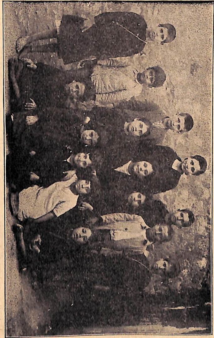
Ամերիկայի Ատանայի Ուսումն. Միության կողմէ Պէյրուքի Հայ Բողոքականաց Գրիգորեան վարժարանում Ատանացի սաներ 1928-ին: