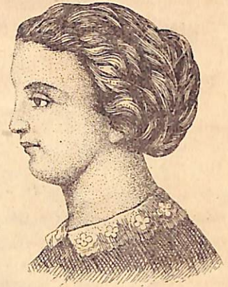
دبشلىرى قنور بلن معرفتيله وضع اولند قدن سكره قادنك صورتقا