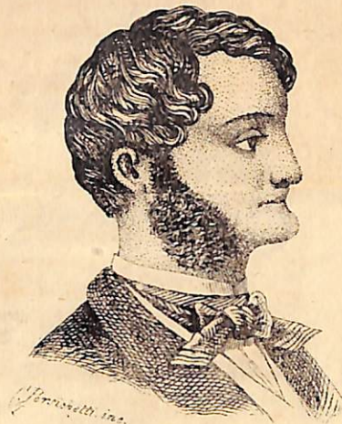
دینشلی اولیان بزم صورت