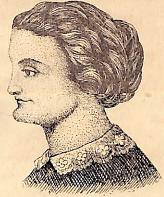
ديشلى اوليان وقادينك صورتى