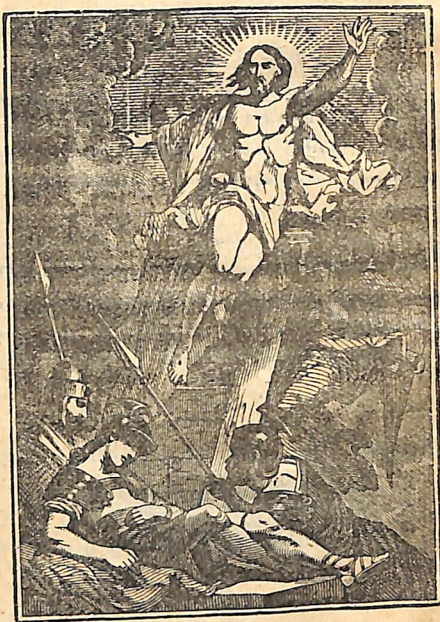
Համարե՛լիք զանձինս մեռեալս մեղացն և կենդանիս Աստուծոյ 'ի Քրիստոս Յիսուս 'ի Տէր մեր: Հոով. 2. 11-13: