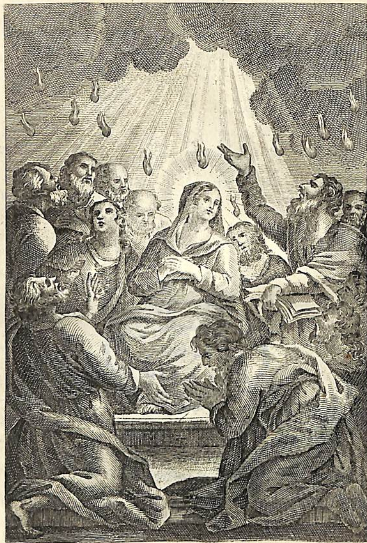
Գալուստ Հոգւոյն Արբոյ: