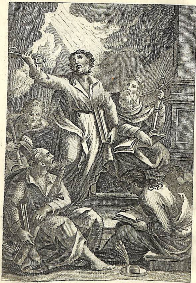
Առաքելական Թղթոց մատենագիրք:

1 ԱԲ. Պաւղոս ծանայ Յիսուսի Քրիստոսի, կոչեցեալ Առաքեալ, որոշեալ յաւետարանն Աստուծոյ, որ յառաջ խոստացաւ ՚ի ձեռն մարգարէից իւրոց գրովք սրբովք, վասն Որդւոյ իւրոյ՝ եղելոյ ՚ի 4 զաւակէ Դաւթի ըստ մարմնոյ. սահմանելոյ Որդւոյն Աստուծոյ զօրութեամբ ըստ Հոգւոյն սրբութեան, ՚ի յարութենէ մեռելոց Յիսուսի Քրիստոսի Տեառն մերոյ. որով ընկալաք շնորհս և առաքելութիւն ՚ի հնազանդութիւն հաւատոց յամենայն հեթանոսս՝ վասն անուան նորա, յորս և դուք 7 էք կոչեցեալ Յիսուսի Քրիստոսի. ամենեցուն ուրոց էք ՚ի Հռովմ՝ սիրելեաց Աստուծոյ՝ կոչեցելոց սրբոց: Ենորհք ընդ ձեզ և խաղաղութիւն յԱստուծոյ Հօրէ մերմէ, և ՚ի տեառնէ Յիսուսի Քրիստոսի: 8 Նախ գոհանամ զԱստուծոյ իմոյ ՚ի ձեռն Յիսուսի Քրիստոսի վասն ձեր ամենեցուն, զի հաւատք 9 ձեր պատմեալ են ընդ ամենայն աշխարհ: Վկայ է ինձ Աստուած, զոր պաշտեմն հոգւով իմով յաւե-