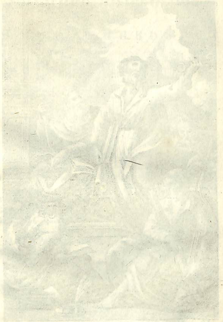
Faint, illegible text, likely a caption or description of the illustration above.