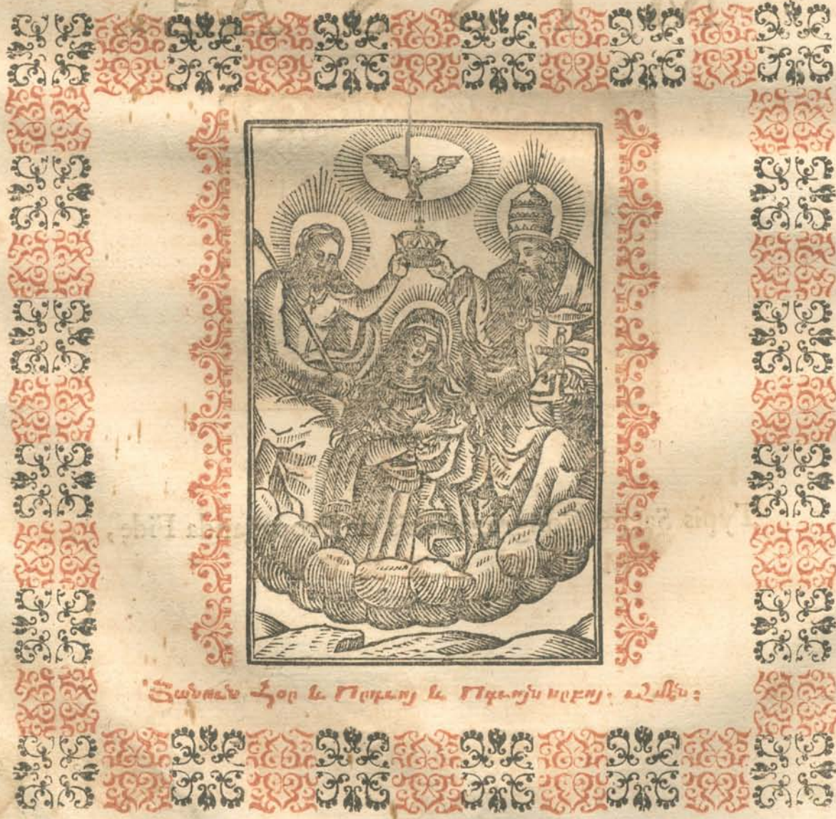
Յանուս հօր և որդւոյ և Ողբոյն սրբոյ. Ա՛մեն:

Նոյնպէս և շաղկիսն այսէ, և ուրախիս, և գօտւոյն, և բազմանիս, և շուր Չառիս: