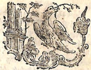
Ծնունդ տն մերոյ Յնի Քսի:

Մանուկ Յնու Տոհոյապէլ ասէլի: *Յ.Յ.Յ.Յ.Յ.*