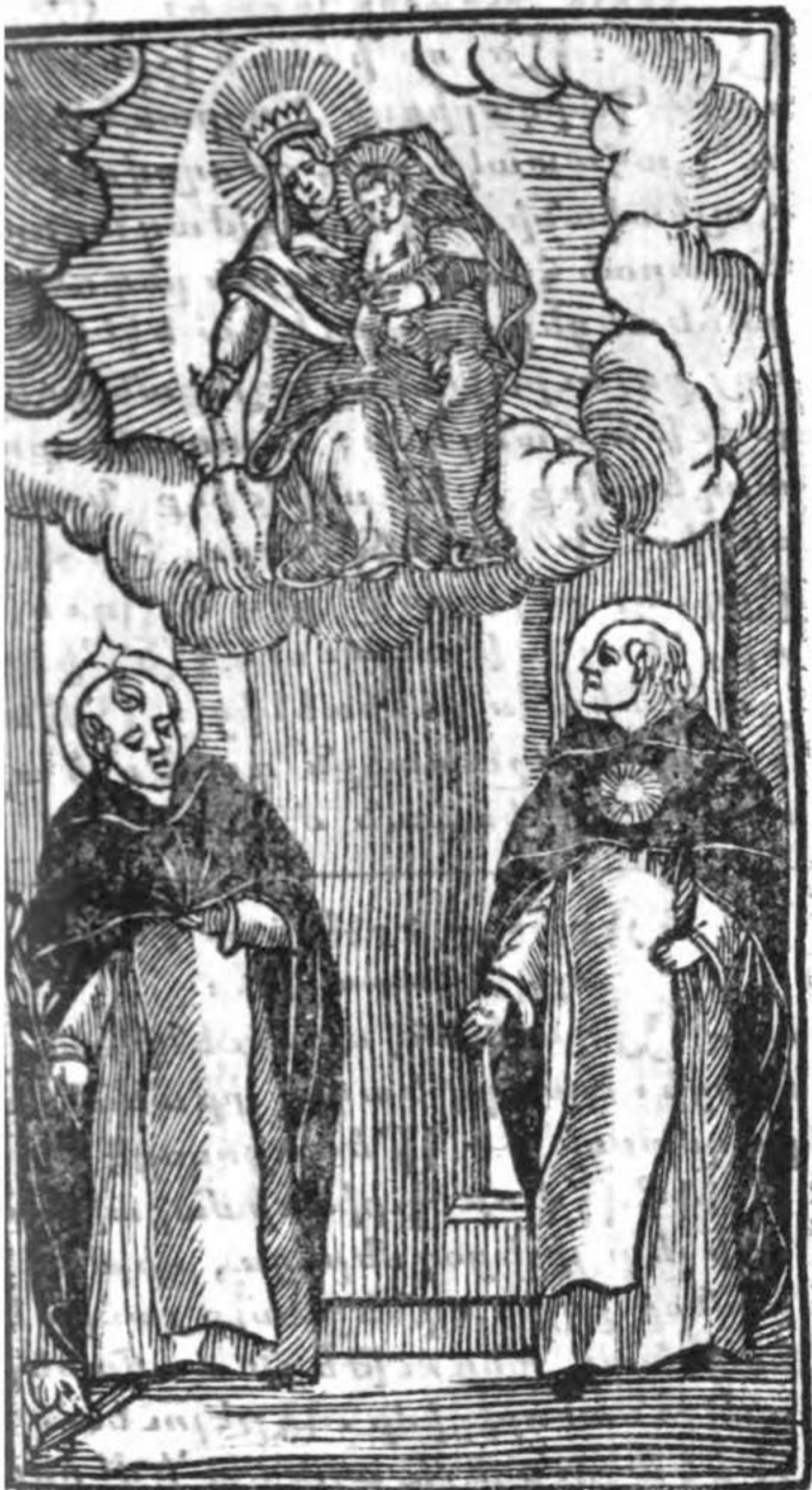
U e Souffrance . || U e Droug L'Anasthousy .